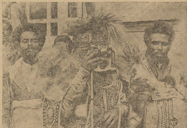
Jeden z wybitnych wodzów abisyńskich otrzymał nowoczesny aparat fotograficzny. Jak widziemy na zdjęciu, z wielkim przejęciem usiłuje przeniknąć arkana nowej dla siebie sztuki.