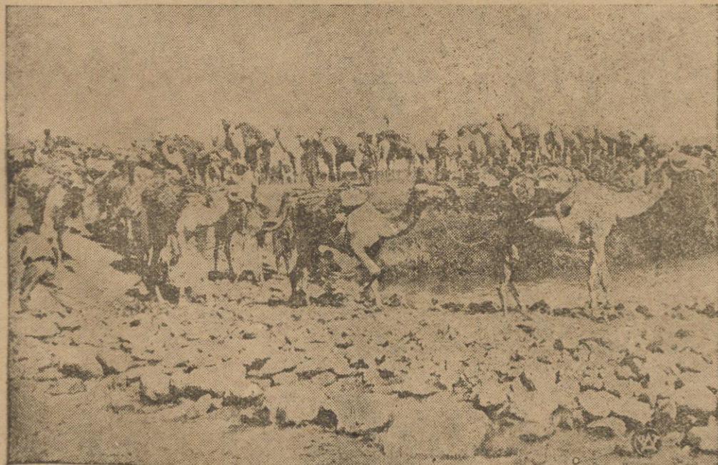
Fragmenty z ofensywy włoskiej na Makalle.