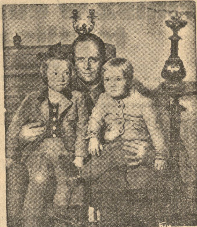
25 bm. przybył do Warszawy z wizytą oficjalną minister spraw zagranicznych Rzeszy Niemieckiej von Ribbentrop. Zdjęcie przedstawia von Ribbentropa ze swymi dziećmi Urszulą i Adolfem.