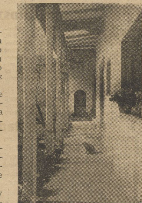
Valdemosa. Ganek mieszkania Chopina w klasztorze Kartuzów. Pierwsze okno — pracownia Chopina.

korzeni powstało z glazów, by zastąpić w tragicznym geście niemego odruchu paniki. Oto węże i wierzby z Lysej Góry. Oto zbojcekie maczugi. Oto drzewne warkoczki wystrzeliły z