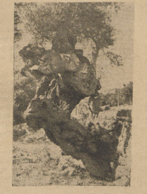
Majorca. 1000-letnie drzewo oliwne, wyrastające z kamienia.

jorkańską, patrząc będziemy na lasy oliwne, na uśmiechnięte wioski i winnice i gaje migdałowe wzdłuż łańcuchów skalistych gór, wśród gęstwy ciemnej zieleni, potęgającej oślepiającą białosć domków o płaskich dachach. Bardziej na północ Inca, ongi osrodek