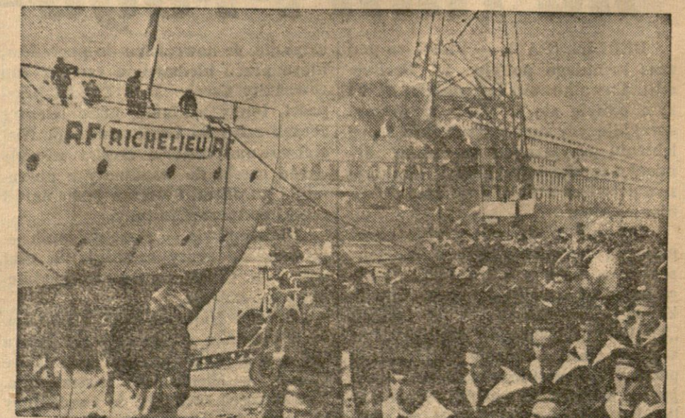
Moment spuszczenia na wodę w porcie Brest wielkiego francuskiego pansernika „Richelieu” o pojemności 35.000 ton.