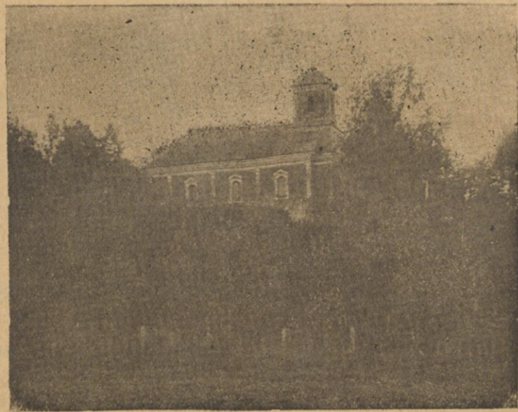
Dawny skarbiec Rdułtowskich zamieniony w 1835 r. na cerkiew.

Daj Boże, aby to polskości tej wyszło na zdrowie! I obyż przynajmniej owa rozdrobiona i uszczuplona „większa własność” dała rady przetrzymać obecny kryzys rolniczy. Bo choć guma pełna, choć po folwarkach gospodarstwo coraz kulturalniejsze, a nierzadko i uprzemysłowione (produkcja oleju, dachówek, pustaki, torf etc.) a we dworach gęsto „najnowsze zdobycze techniki” — radja wielolampowe, auta, traktory, czasem i elektryczny oświetlenie — jednak o kredyt trudno i niejednego właściciela pięknego gospodarstwa żyra na wekslu miejscowej kapitalistycznej „już” nie przyjmują. Mimo to żyje się jakoś, choć jutro każdego niemal rolnika zamglone i nie pewne.