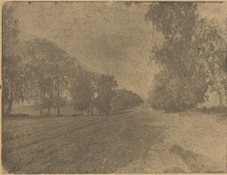
Trakt ze Snowa do Nieświeża.

na, budynki akuratne, zaprzęgi „ścipniejsze”. Znac już inną naturę, inny temperament — bardziej gospodarski, kiedy na Wileńszczyźnie przeważają duży rybacze i „ochotnicze”. Po dwa rach i dworach znać piętno dbałości