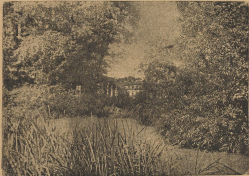
Widok na pałac w Snowie.

o estetykę — otoczenie tu niezawsze wdzięczne, często płaskie, wilgotne, bezleśne — ale ogrody porządne, między drzewami owocami kwiatne rabaty, do wyjazdu koniki dobrze czyszczone, w chomątach krakowskich lub szorkach, na werandach kilimki, haftowane poduszki — i gazetki warszawskie — aż przypomni się jakieś katnowskie czy siedleckie. Krajobraz czasem monotony, równy i niski — ku Szczarzewi, czasem łagodnym pofalowaniem wzgórz ku błękitnemu Niemniowi pogodnie uśmiechnięty, ale