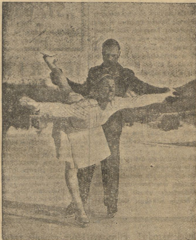
Reprodukujemy moment z klasycznej jazdy figurowej na lodzie, wykonanej w St. Moritz przez słynną łyżwiarkę Cecylię Colledge w towarzystwie jej trenera znanego łyżwiarza szwajcarskiego Gerschwilera. Jest to trening przed światowymi mistrzostwami w jeździe figurowej na lodzie.