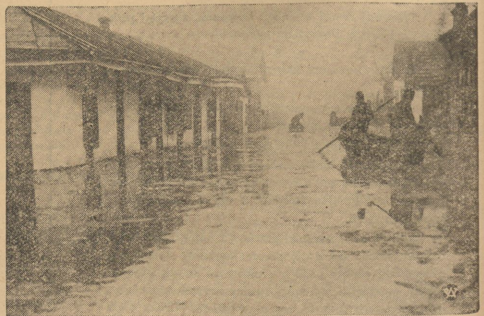
Obrazek z powodzi, która nawiedziła Rumunię w okolicach miasta Vacov, wskutek nagłej zmiany temperatury i roztopów śnieżnych. Wskutek powodzi w Vacov ewakuowały część ludności miasta Vacov. Komunikacja po ulicach miasta odbywa się łódkami.