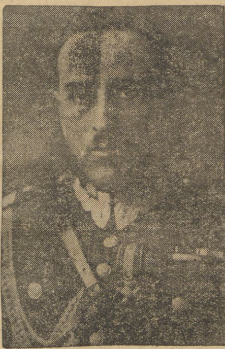
część gen. Skwarczyńskiego, szefa O. Z. N.

Po przemówieniu swym gen. Skwarczyński wraz z małżonką osobiście zebrał się z licznymi zebranymi przedstawicielami społeczeństwa wileńskiego. Jutro o godz. 16 gen. Skwarczyński opuszcza już na stałe Wilno.