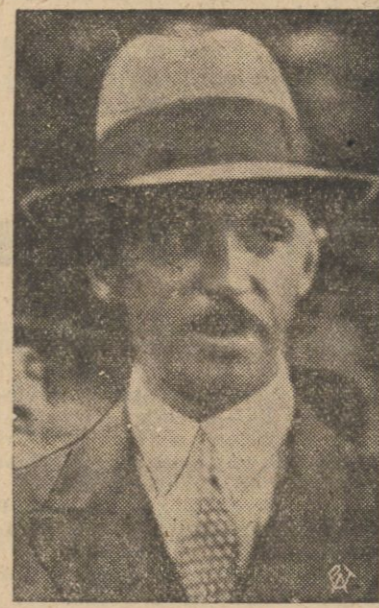
W tych dniach zmarł w Paryżu przeżywszy 47 lat ks. Sixtus Bourbon-Parma, brat b. cesarzowej austriackiej Zyty.