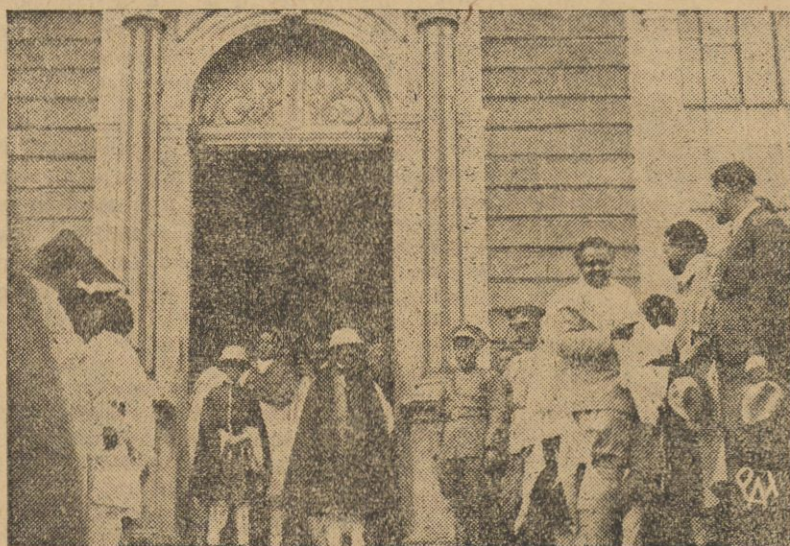
Cesarz abisynijski opuszcza wraz z synem katedrę Sw. Jerzego po nabożeństwie na intencję utrzymania niepodległości państwa.