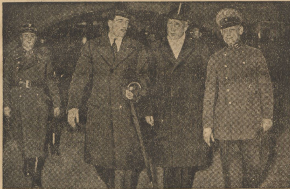
Po konferencji w Berlinie, angielska delegacja wyjechała do Moskwy. Na zdjęciu — lord Eden w towarzystwie sekretarza stanu von Bülowa na dworcu berlińskim.