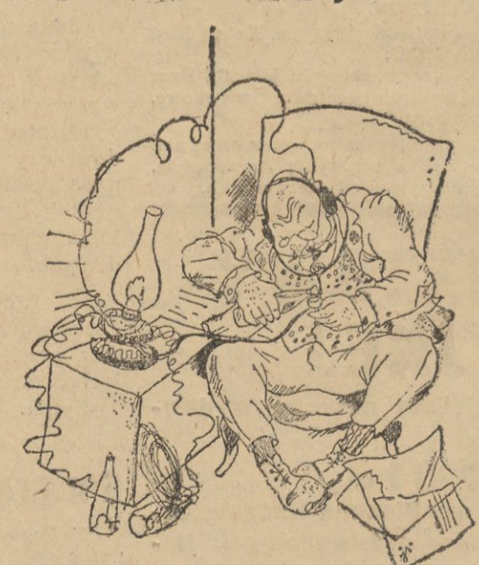
Jednolampowiec ze wzmacniaczem