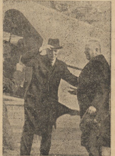
Min. Simon na chwilę przed odlotem z Berlina

W Haskowo odbył się proces 69 komunistów, z których 39 zostało skazanych na karę więzienia od 1 roku do 15 lat.