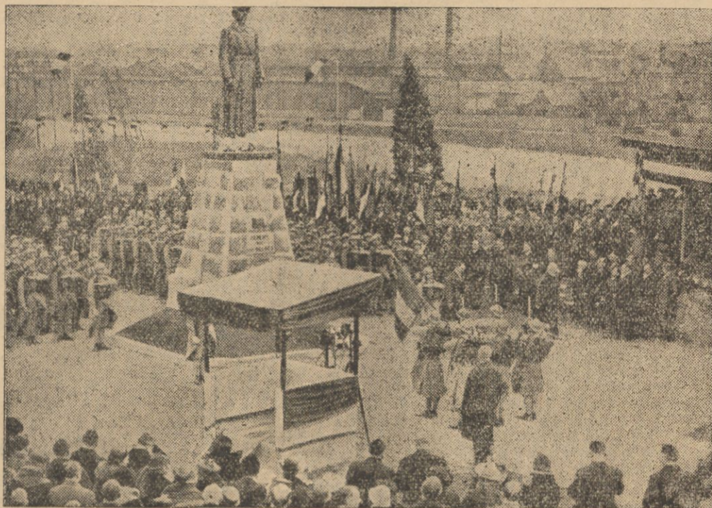
W Charleville-Mezieres odsłonięto pomnik Alberta I, króla Belgów. Na ilustracji moment uroczystości odsłonięcia.