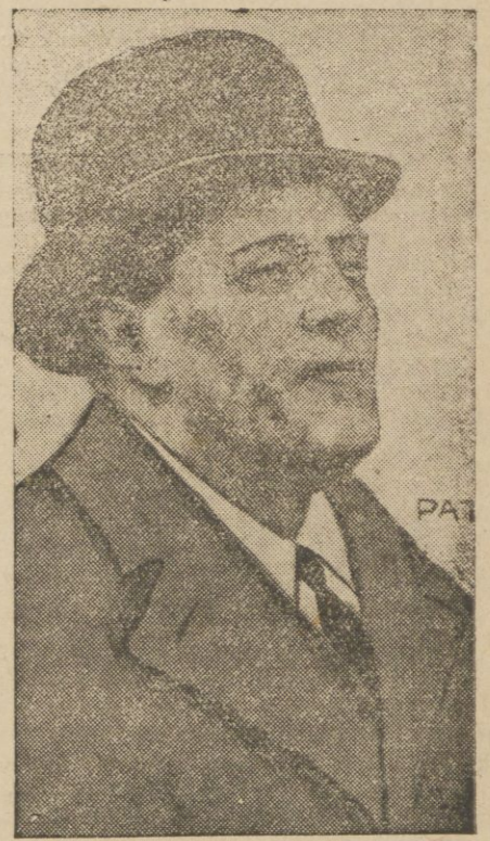
W poniedziałek wieczór zmarł w Gdańsku Wysoki Komisarz Ligi Narodów margrabia Manfred Grawina.