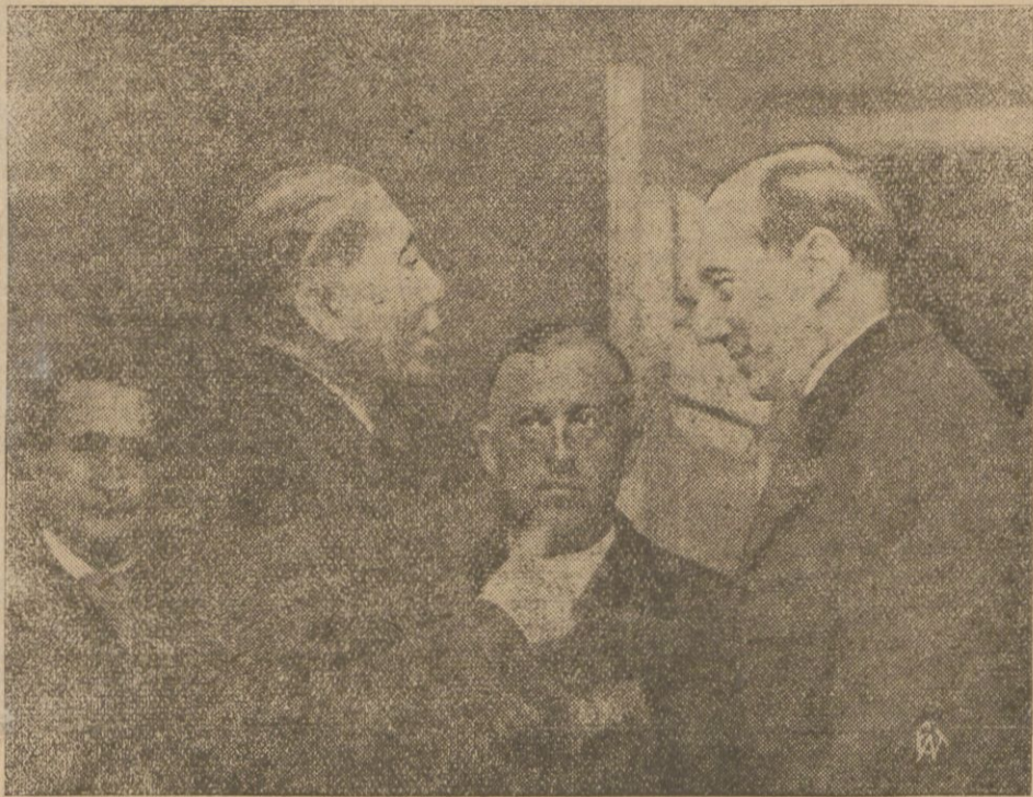
Zdjęcie nasze przedstawia moment powitania ministra Titulescu przez p. ministra Józefa Becka.