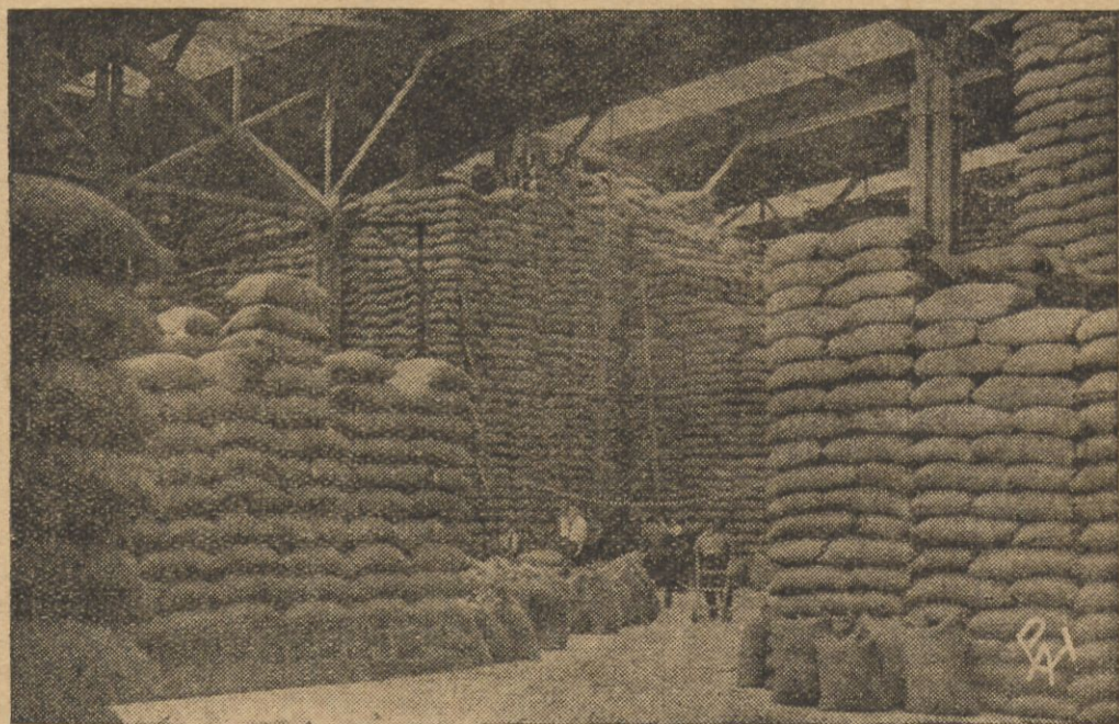
Praca w porcie. Wnętrze łuszcarni ryżu.