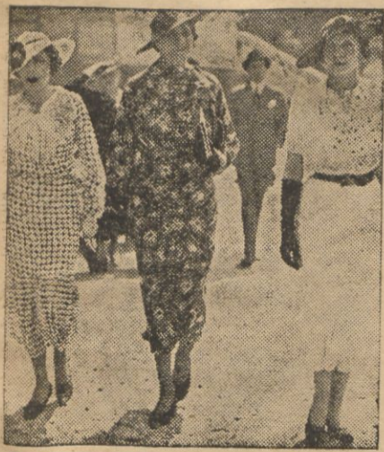
PIĘKNE MODELE LETNICH SUKIENEK.

Pierwsze miejsca zajęły 3 zespoły, w tem 2 wojskowe: Kompania 2-ga i Kompania Obwodowa, oraz zespół cywilny Związku Strzeleckiego w Grzegorzewie — wszystkie w jednakowym czasie 12 min. 30 sek. otrzymując nagrodę w postaci tablicy mahoniowej.