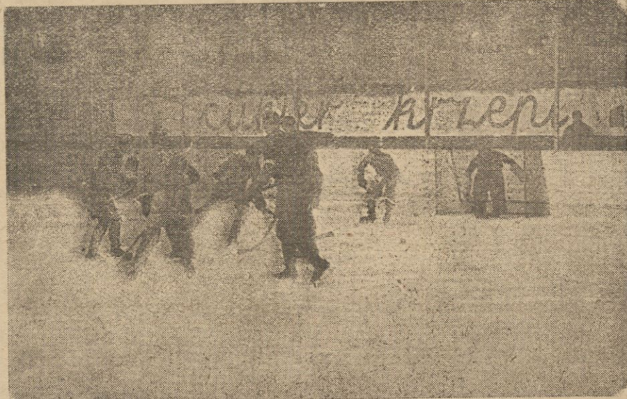
Moment z meczu Kanada — Francja (9:0) Bramka francuska w opałach.