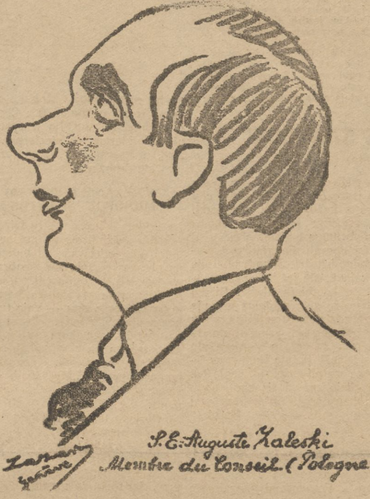
August Zaleski Membre du Conseil (Pologne).