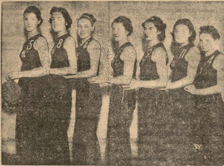
W Katowicach zostały rozegrane mistrzostwa Polski w siatkówce pań z udziałem 8 drużyn z różnych miast Polski. Na zdjęciu — drużyna AZS — Warszawa, która zdobyła mistrzostwo Polski.