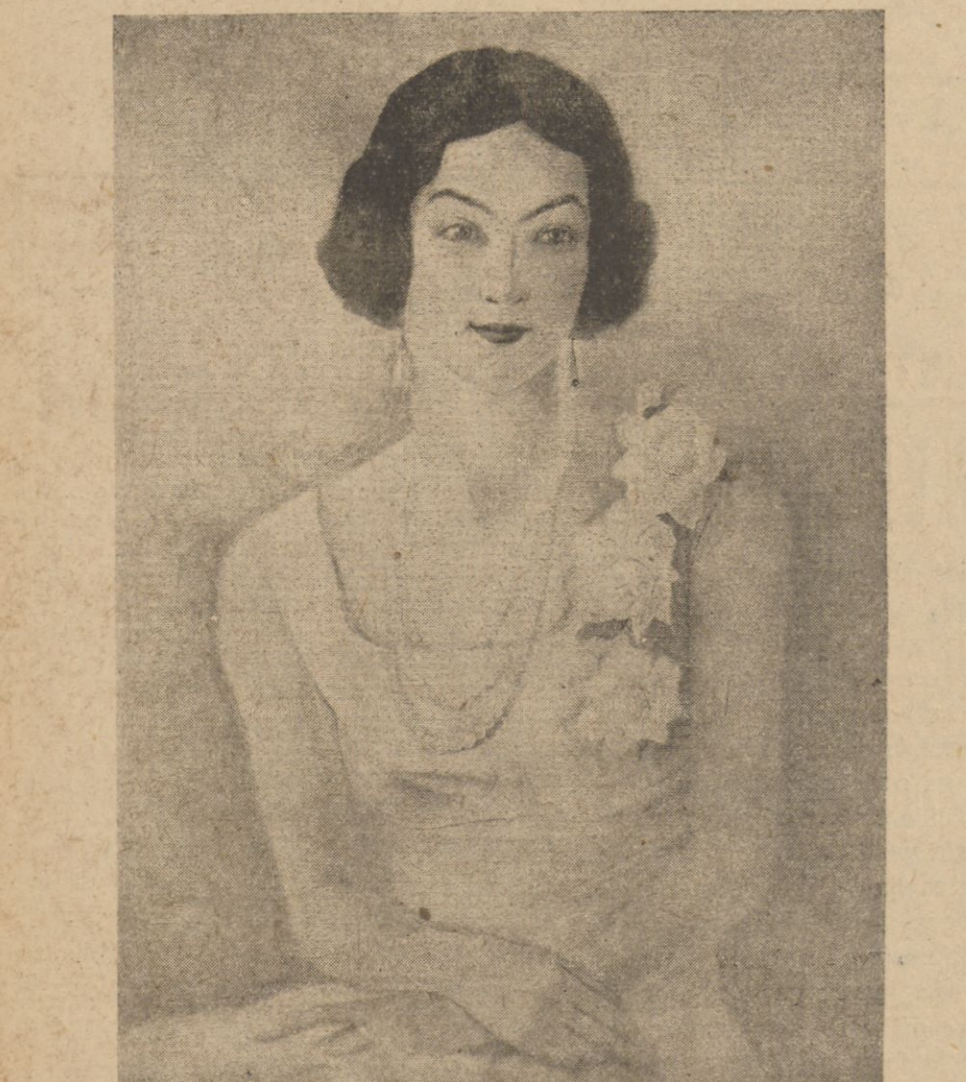
Portret M-me S. B.