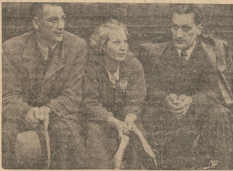
Znana lekkoatletka Jadwiga Wajsówna w rozmowie z bokserskim mistrzem Polski Piłatem i b. mistrzem Polski w rzucie kulą Heljaszem.