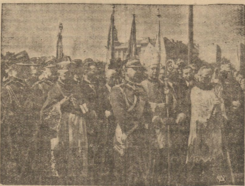
Pan Marszałek Edward Śmigły Rydz przemawia na uroczystościach poświęcenia i przekazania oddziałom artylerii sztandarów ufundowanych przez społeczeństwo województwa wileńskiego.