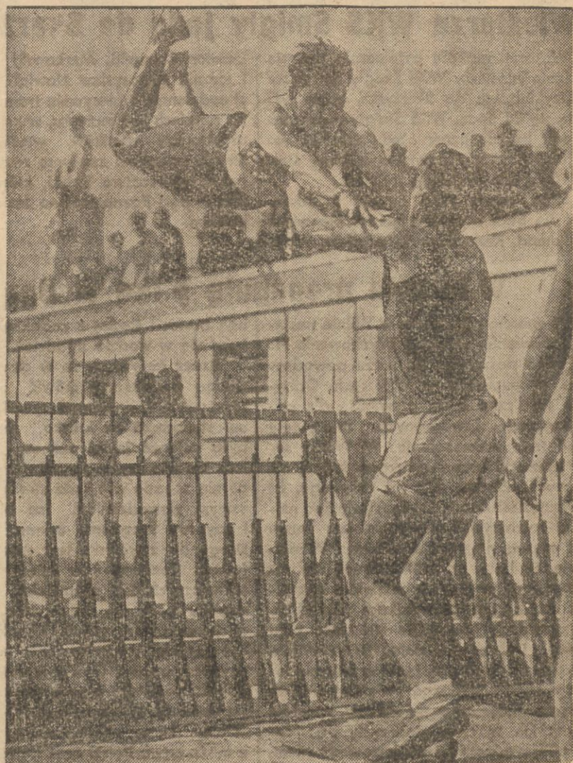
Zdjęcie zostało dokonane podczas popisów przed Mussolinim sprawności fizycznej kierowników partii faszystowskiej. Sekretarz partii wykonuje wspaniały skok ponad stojakiem z karabinami najeżonymi ostrzemi bagnętów.