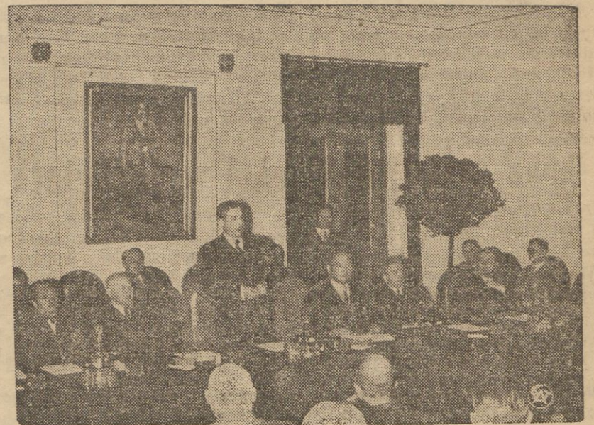
W Ministerstwie Przemysłu i Handlu odbyła się konferencja w sprawie gospodarczego podniesienia ziem północno-wschodnich. W konferencji, która odbyła się pod przewodnictwem p. vicepremiera inż. Eugeniusza Kwiatkowskiego, wzięli również udział: Marszałek Senatu Aleksander Prystor, p. p. ministrowie Roman, Ulrich, Kościółkowski i Poniałowski. Na zdjęciu — moment z konferencji podczas przemówienia p. vicepremiera Kwiatkowskiego.