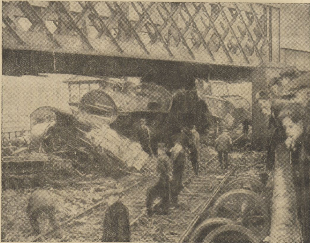
Niedawno w szkockiej gminie Stevenston w hrabstwie Ayr wskutek złego nastawienia zwrotnicy zderzyły się dwa pociągi towarowe. Na ilustracji szczytku obu pociągów na miejscu zderzenia w parę godzin po katastrofie.

Kostjumowy Bal Sztuki 9.II. „W JEDNĄ NDC NAOKOŁO ŚWIATA” 9.II. Wejście 4 zł., akadem. 2 zł. — Izba Przem-Handl.