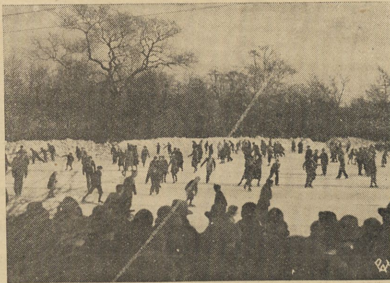
Jedną z najbardziej malowniczo położonych w Warszawie ślizgawek jest ślizgawka na stawie w Parku Ujazdowskim, uczęszczana chętnie zarówno przez młodszych jak i przez starszych