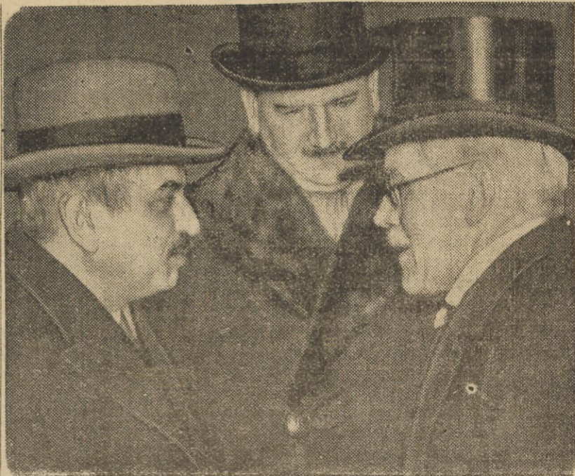
Laval, Flandin i Mac Donald.

W razie powodzenia tych kroków przysiężone wawczych spodziewają się w Londynie, że w drugiej połowie marca zwołana będzie w Londynie lub Brukseli konferencja międzynarodowa, w celu przeprowadzenia rokowań o konwencję lotniczą pomiędzy W. Brytanią, Francją, Niemcami, Włochami i Belgją.