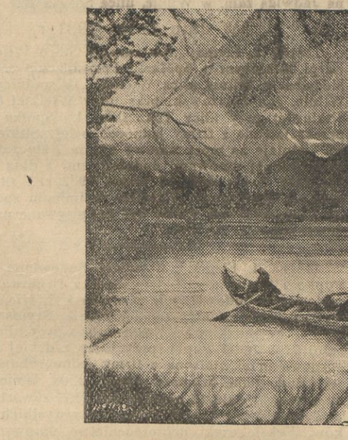
Uczestnicy podróży wycieczkowej okrętem „Polonia” do krain południowych mieli okazję zwiedzić piękne zakątki tak zw. Laplandji — kraju leżącego u zbiegu granic Norwegji, Szwecji i Finlandji.

Widok jeziora Torne Traak pod Riksgranan.