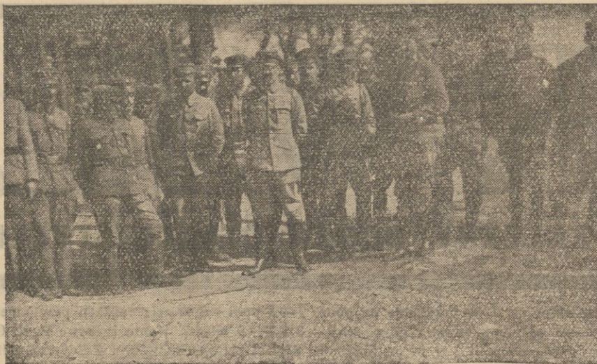
Komendant Piłsudski ze sztabem 1-ej Brygady nad Styrem w roku 1916-gm.

Lecz ponad wszystkie honory i odznaczenia, drodzy, rozsypani po całym świecie i obecni w Wilnie „Pierwszacy”, nikt Was większem nie oddarzą szczenięciem, niż to którego dzisiaj doznacie, gdy pułk Wasz w parady swego święta, tu w Wilnie, przed Nim, Pierwszym Żołnierzem Niepodległej Polski, wiernie Mu w oczy z niezmąganą żołnierską miłością patrzacie — przemaszera... S. Z. KL.