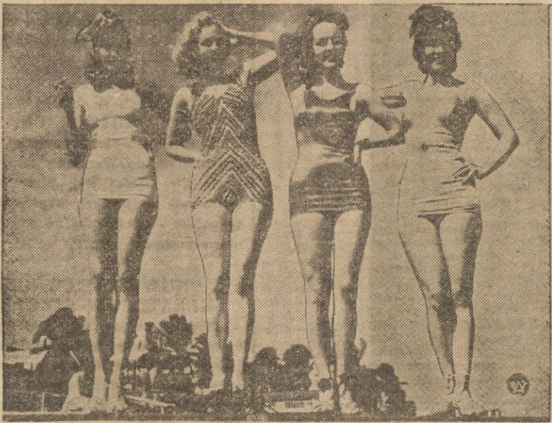
Prezentacja najnowszych kostiumów kąpielowych na słynnej plaży Miami na Florydzie.