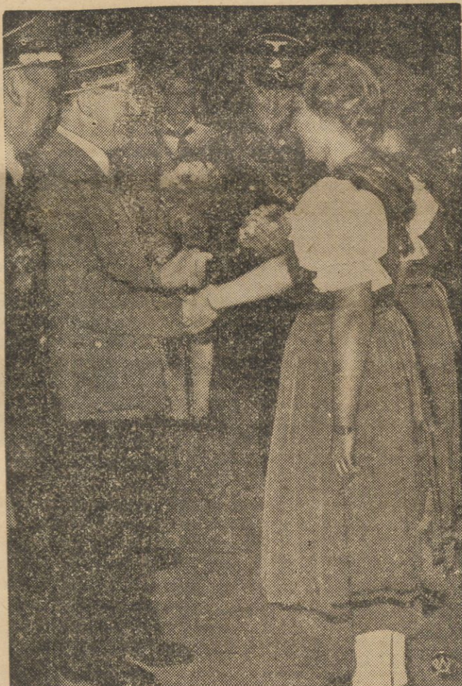
Powitanie kanclerza Hitlera przez młodzież szkolną w Grazu, podczas przedplacowej podróży kanclerza po Austrii