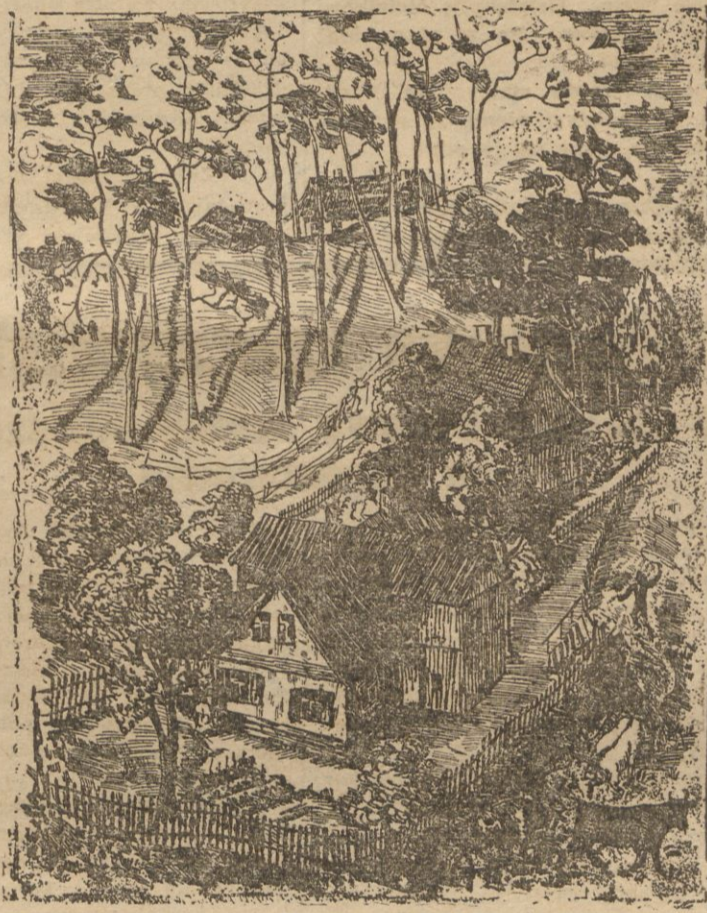
„DOMKI NA ANOKOLU” HANNA MILEWSKA Akwaforia, 21x27. Cena 7 zł.

Zamówione obrazy będą do odebrania w administracji pisma od dn. 10 bm. za opłaceniem należności. Na koszty ewentualnej przesyłki pocztowej należy dodatkowo przesłać 50 gr.