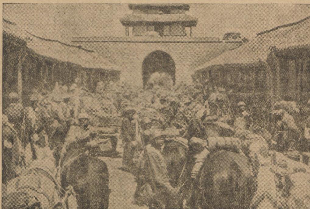
W związku z dążeniami autonomistycznymi różnych gubernatorów i generałów w Chinach północnych rozpoczęli Japończycy obsadzanie szeregu linii kolejowych m. in. ważnej stacji węzłowej Tsinansu. Na ilustracji kawaleria japońska w hełmach wkracza do Tsinansu.