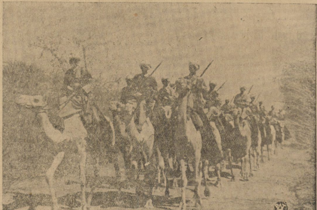
Oddział askarisów włoskich patrolujący okolice.