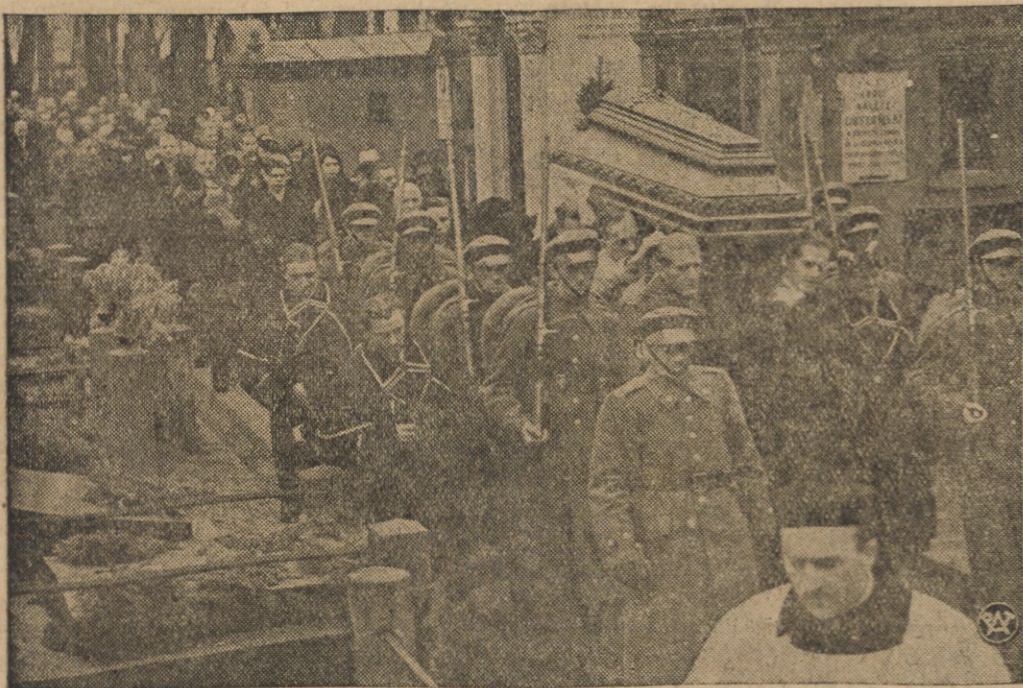
Znakomity nowelista i powieściopisarz, członek Polskiej Akademii Literatury, Piotr Chojnowski pochowany został w Alei Zasłużonych na Cmentarzu Powązkowskim w Warszawie. — Na zdjęciu fragment pogrzebu — trumna w Alei Zasłużonych niesiona przez żołnierzy I-ej Brygady Legionów—kolegów zmarłego pisarza.