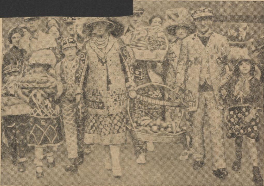
Handlarze uliczni w Londynie co rok urządzają oryginalne „dożynki“, poprzedzane zawsze dziesięcym nabożeństwem w koście św. Marii Magdaleny. Na zdjęciu — handlarze w ubraniach, fantazyjnie ozdobionych guzikami z masy perłowej, idą do kościoła, niosąc jesienne plony — owoce.