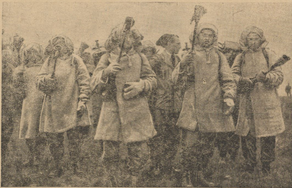
Oddział miotaczy ognia, ubrany w płaszcze azbestowe.