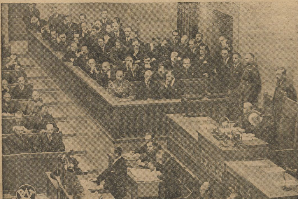
Premier Marjan Zyndram-Kościałkowski odczytuje tuje exposé. W głębi siedzą członkowie gabinetu.