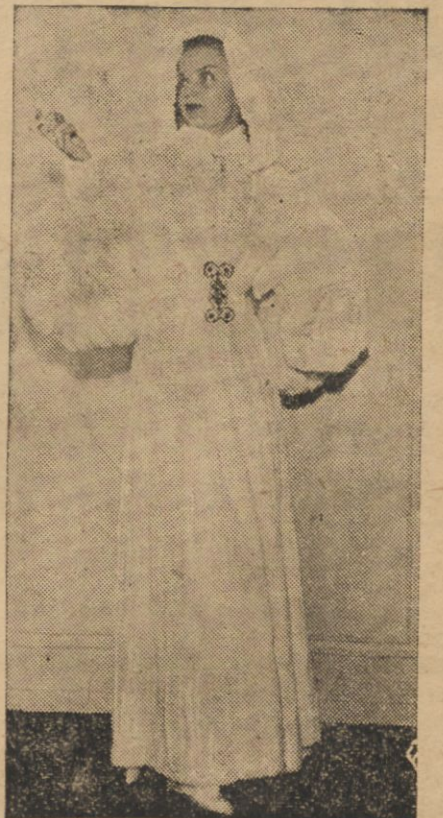
Na jednym z pokazów mody w Nowym Yorku zademonstrowano płaszcz wieczorowy z gronostajów, który pewnością spędzi sen z oczu niejednej elegantki na długie tygodnie.