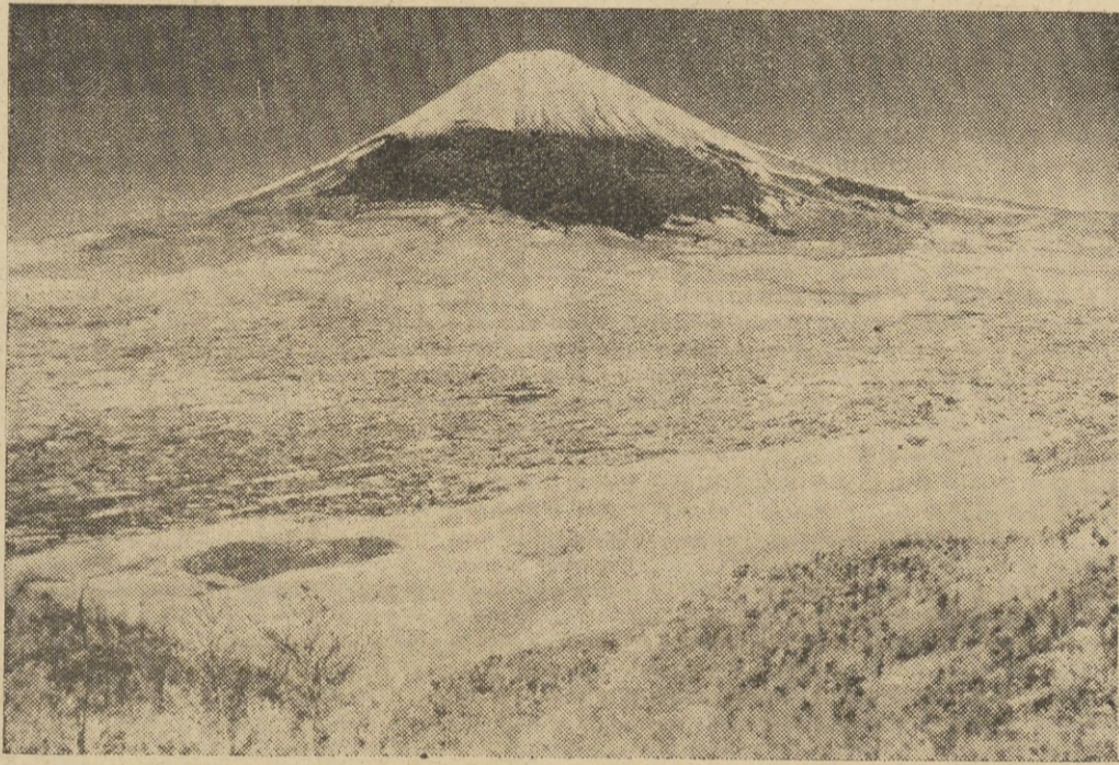
Przepiękny widok najwyższej w Japonii góry Fujiyama, sfotografowanej na zarządzenie tokijskiego Instytutu Naukowego z odległości 250 klm. przy pomocy specjalnych promieni.