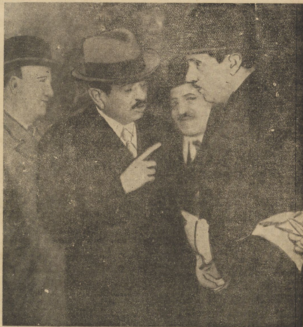
Laval na dworcu w Paryżu przed wyjazdem do Genewy.