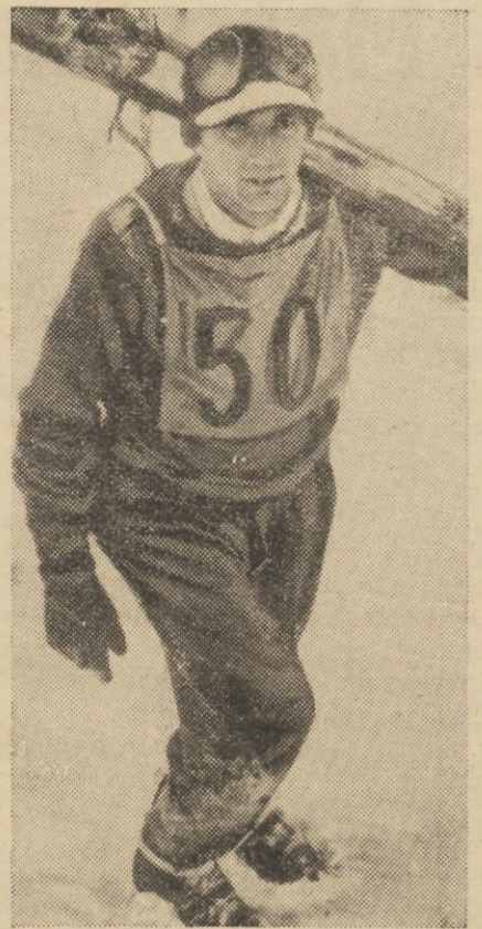
Niemiecki mistrz skoków na nartach Stall - Berchtesgaden, który na zawodach w Oberammergau skoczył 62 i 63 mtr., zajmując czolowe miejsce przed Norwegami Birgerem Ruudem (61 i 63 mtr.) i Reidarem Andersenem (58 i 62 mtr.).