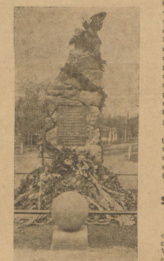
W Lublinku pod Łodzią dokonano w dniu 15 b.m. wśród wielkich uroczystości odsłonięcia pierwszego na ziemiach Rzeczypospolitej pomnika ku czci ś. p. kpt. Żwirki i inż. Wigury. Na zdjęciu naszym podajemy widok pomnika.

WIEDEN PAT. — W rozmowie z korespondentem PAT-a kpt. Bajan oświadczył, że katastrofa jego samolotu nastąpiła nie tylko z powodu lekkiego podmokłego terenu, ale raczej z powodu gwałtownego wiatru. Po starciu na zbroczu ścianał wiatr zstępujący maszynę wódł. Nastąpiło zderzenie z drzewem, poczem aparat pochylł się ku ziemi, uderzywszy zaś o nią, stanął w płomieniach. Kpt. Bajan i jego pomocnik uratowali się szybkim wyskoczem z aparatu. W ciągu 15 minut samolot spłonął doszczętnie. Pod wpływem gorąca stopił się nawet motor. Wszystkie dokumenty lotu nie uległy zniszczeniu. Po opatrzeniu przez lekarza kpt. Bajan udał się autobusem do Klagenfurtu.