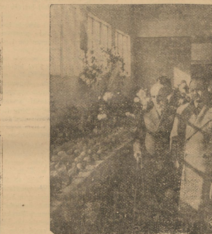
P. Mln. Opieki Społecznej Marian Zyndram-Kościałkowski podczas zwiedzania wileńskiej wystawy owocowej.