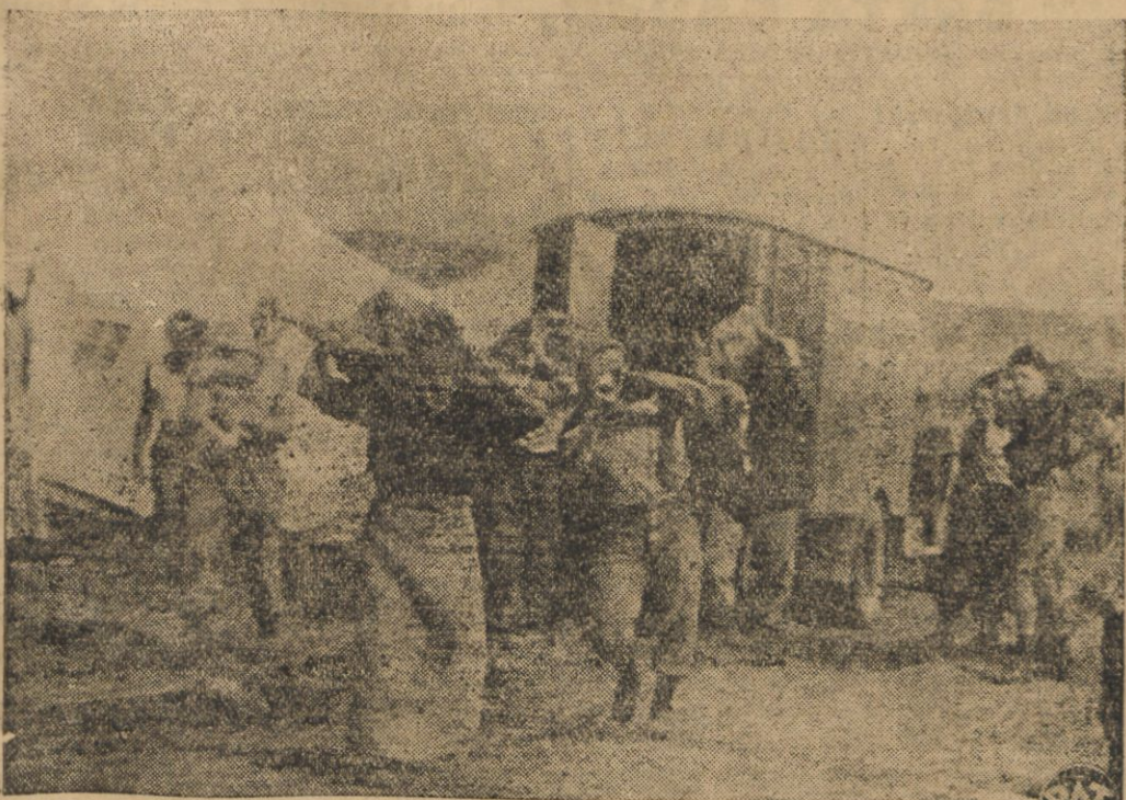
Transport mięsa dla oddziałów włoskich frontu północnego.