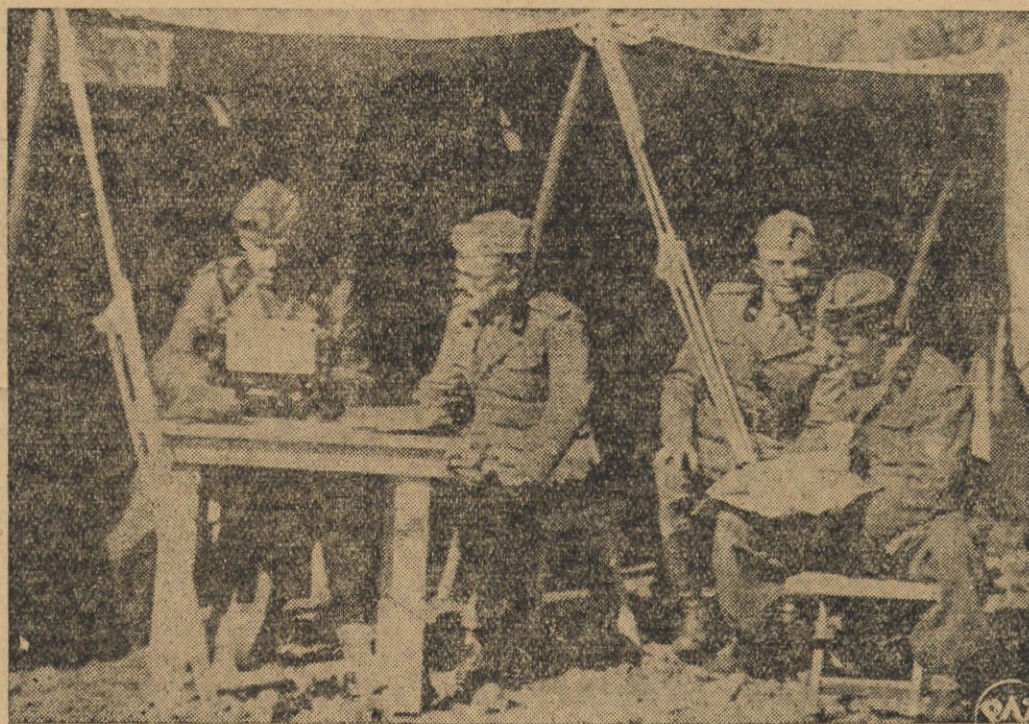
Główna kwatera włoska na froncie północnym.

Abisyńczycy umocnili się poważnie w Makalle, gdzie oczekują Włochów. Posuwanie się naprzód armii włoskiej, która wkroczyła na równinę Aussa, napotyka, według tych samych źródeł włoskich, na trudności, gdyż Abisyńczycy przed opuszczeniem tych miejscowości zamieczyli wszystkie studnie.