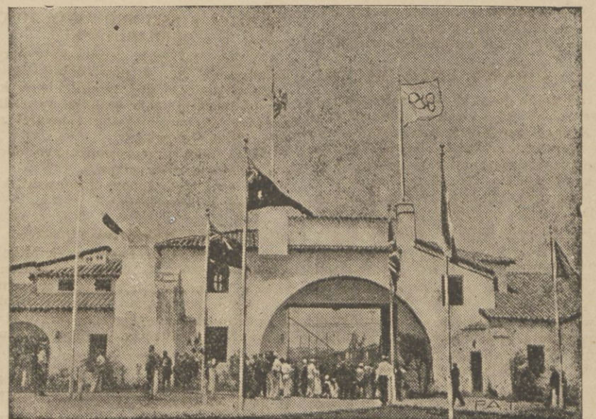
Marzeniem wielu osób przybyłych na Olimpiadę do Los Angeles jest zwiedzić „Wieś Olimpijską“ w której mieszkają zawodnicy przybyli z 50 krajów i wszystkich zakątków globu. Brama tej tajemniczej wioski jest jednak pilnie strzeżona. Na fotografii naszej widzimy tę zamkniętą dla zwykłych śmiertelników bramę.