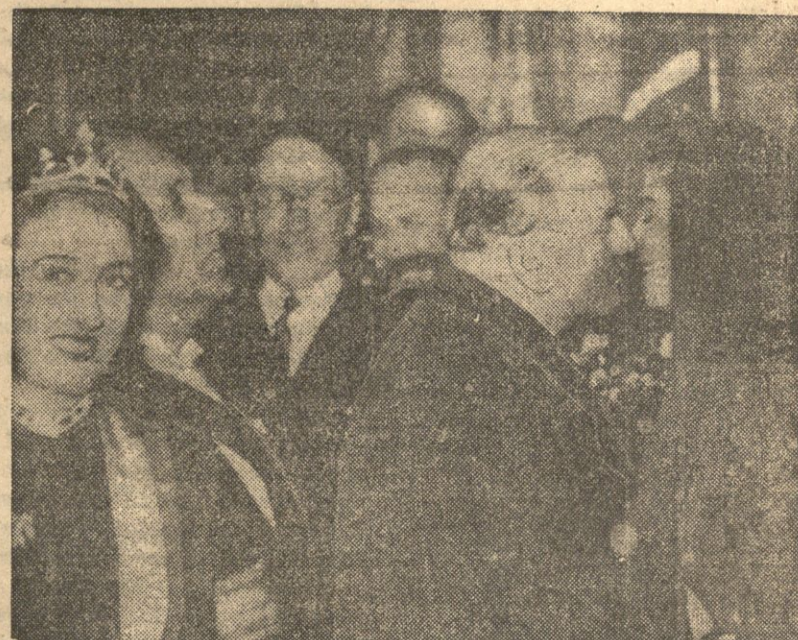
Serdeczne powitanie premiera Daladier przez miejscowe krajanek w kostiumach regionalnych, po przybyciu premiera do gmachu Teatru Wielkiego w Bastii na Korsyce.