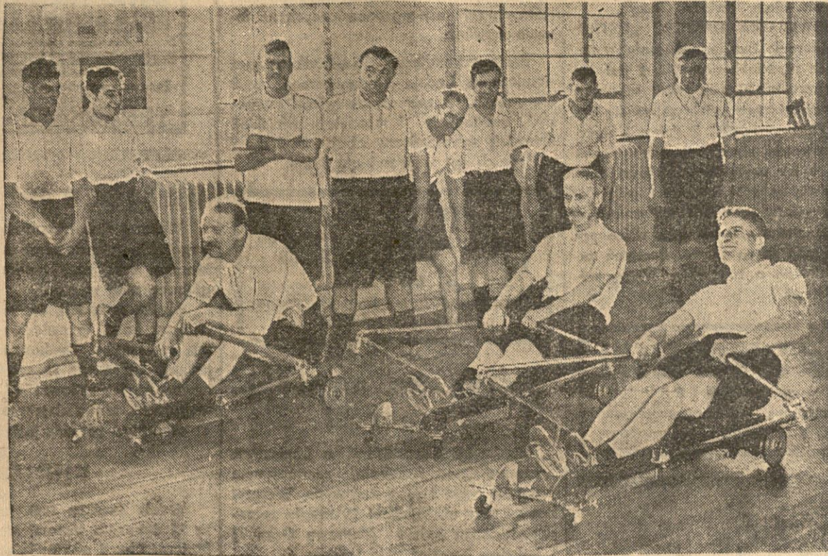
Zagranie cieszą się wielkim powodzeniem aparaty do szkolenia osad wioślarskich. z aparatów tych korzystają również turyści, którzy w okresie zimowych miesięcy przechodzą specjalne kursy.