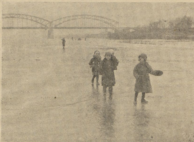
Spacer po tafli lodowej na Wiśle.