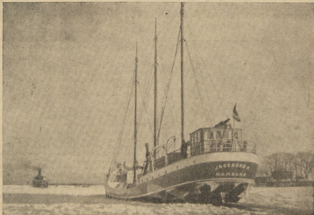
W następstwie silnych mrozów okręty musiały walczyć z zatorami lodowymi. Na zdjęciu — łamacz lodów z Królewca toruje drogę okrętowi, który podąża za nim wolnym od lodów szlakiem.