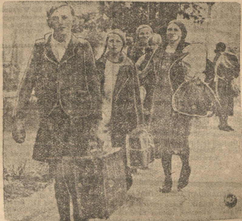
Wielu Niemców, zamieszkałych w Sudelach, przekroczyło ostatnio granicę czechosłowacką, udając się na teren Rzeszy. Na zdjęciu — grupa uciekinierów niemieckich z Czechosłowacji.