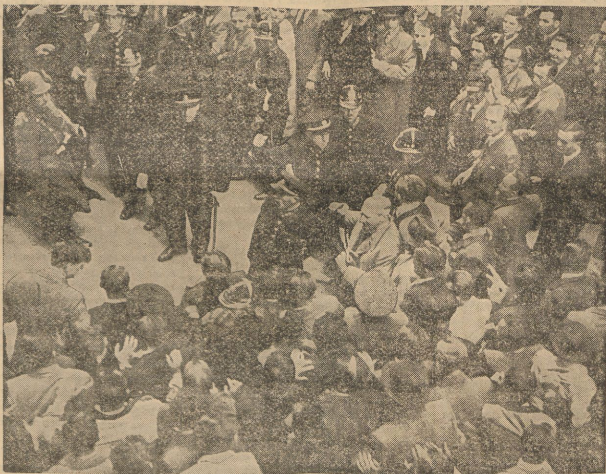
Na zdjęciu demonstracja niemieckich studentów w Eger.