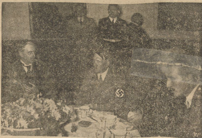
Kanclerz Hitler i premier angielski Chamberlain w rezydencji kanclerskiej w Berchtesgaden w towarzystwie ministra Ribbentropa i ambasadora Hendersona.

Gdyby Czeši mieli wielkiego męża stanu, to dawno dopuściliby on do tego, by Niemcy sudeccy połączyli się z Rzeszą, zapewniając w ten sposób autonomię dla Czechów. Ale p. Benesz jest politykiem, a nie mężem stanu, zakończył kanclerz Hitler.