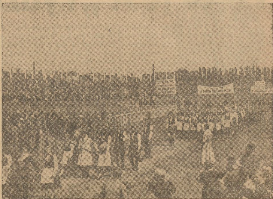
Defilada oddziałów młodzieży wiejskiej ze wszystkich województw ze szfandarami i transparentami przed Panem Marszałkiem Śmigłym Rydzem.