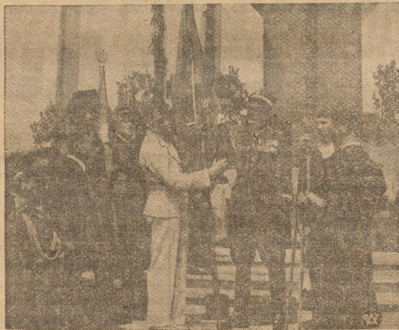
Moment wręczania przez Pana Marszałka Śmigłego Rydza nowopowstałego sztandaru prezesowi Centralnego Związku Młodej Wsi Gieratowi.