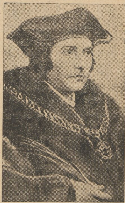
W czasie świąt Wielkanocy ma być kanonizowany Tomasz More (na zdjęciu), święty w r. 1535 z rozkazu Henryka VIII, króla Anglii.