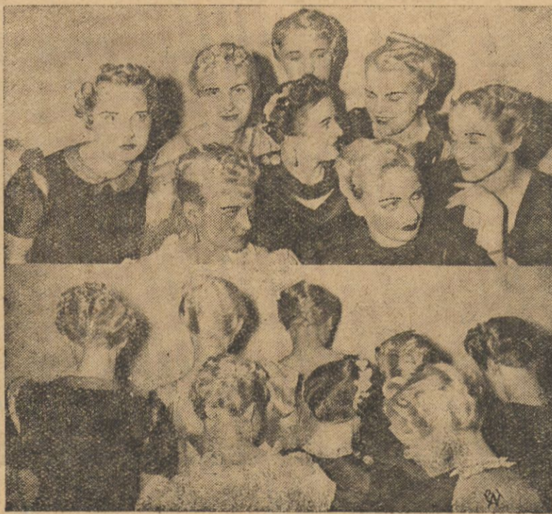
Nowoczesne fryzury pomysł i wykonania uczestników międzynarodowego konkursu sztuki fryzjerskiej, który zakończył się w tych dniach w Berlinie.

Trzeba przyznać że tegoroczna moda wiosna jest wyrozumiała dla naszych kieszeni, gdyż przy nieznacznych zmianach zeszłoroczne kostjumy wiosenne będą wyglądały świeżo i modnie.