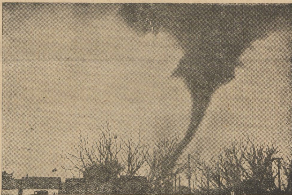
Nad stanem Missisipi w Stanach Zjednoczonych szalało tornado, które pociągnęło za sobą 100 ofiar w ludziach. Miasteczko Gloster, liczące 1200 mieszkańców, zostało zniszczone z powierzchni ziemi. Ilustracja przedstawia trąbę o straszliwej katastrofie, jaka nawiedziła Amerykę.