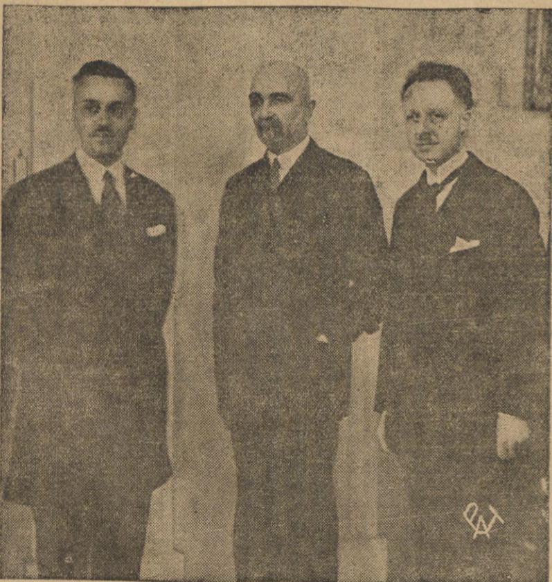
Podczas pobytu w Warszawie min. Radew, został przyjęty przez pana premiera Slawka. Na zdjęciu od lewej: min. Radew, premier Slawka i poseł bułgarski w Warszawie min. Altynow.