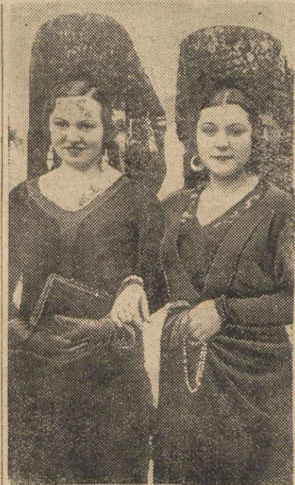
Młode Hiszpanki w uroczyste święta udają się do kościoła w specjalnych strojach. Na ilustracji 2 Hiszpanki, dążące do kościoła w takich strojach sfotografowane na ulicy w Madrycie.