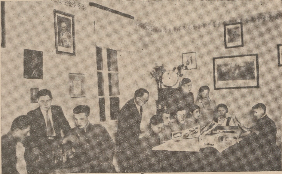
Świetlica Z. S. w Kraśnem n/Uszą.