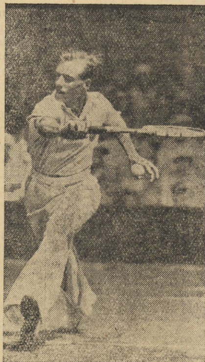
W zawodach tenisowych o puchar Davisa barw Ameryki bronią: na ilustracji od lewej: Donald Budge, von Ryn, Allison, Sidney B. Wood.