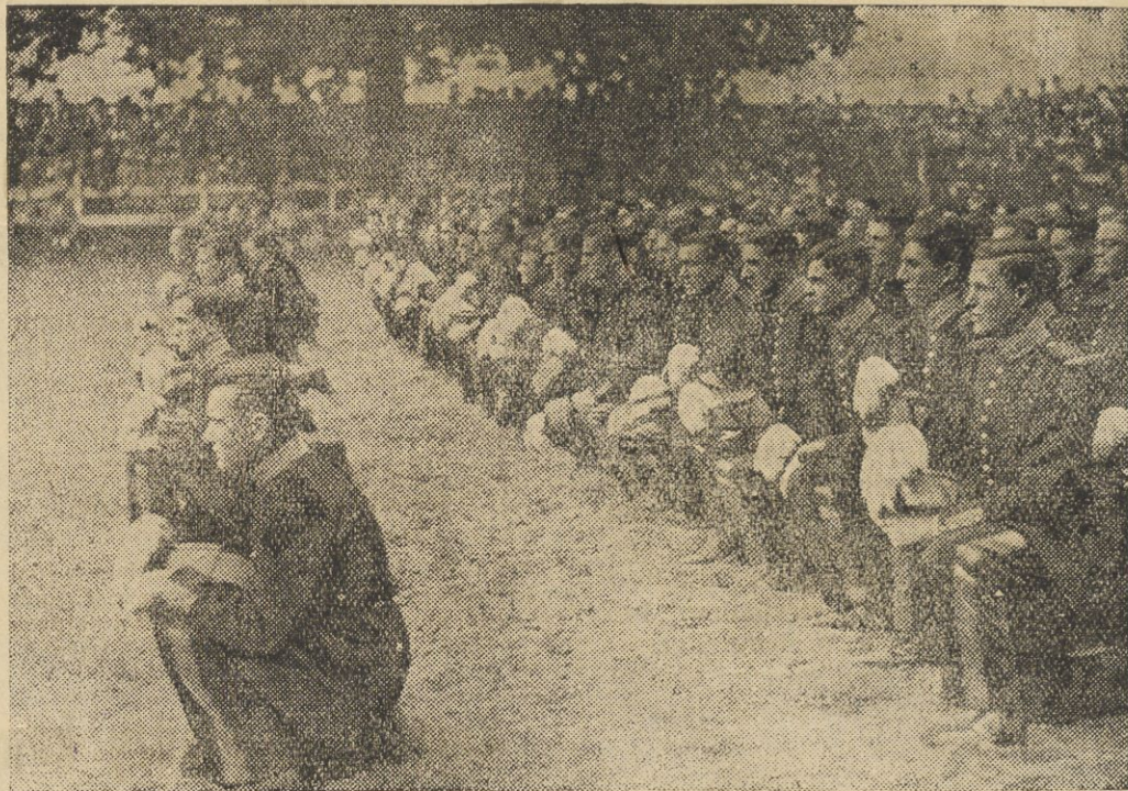
Każdy rocznik absolwentów słynnej francuskiej szkoły wojennej w Saint Cyr w Wersalu otrzymuje nazwę jakiejś wybitnej osobistości. — Tegorocznemu nadano nazwę króla Aleksandra Jugosłowiańskiego. Podczas uroczystości promowania przyszli oficerowie na klęczkach wysłuchują przemówienia.