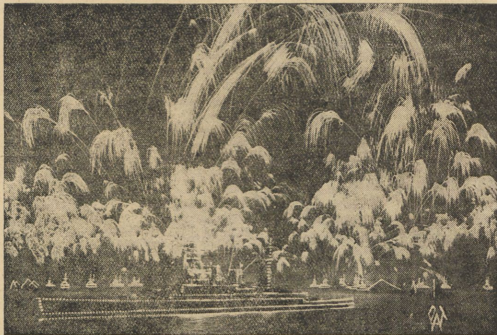
Podczas wielkiej parady floty angielskiej, zorganizowanej na zakończenie uroczystości jubileuszowych 25-lecia panowania króla Jerzego V-go wszystkie defilujące okręty, z których puszczano rakiety były pięknie iluminowane, co złożyło się na wspaniałe widowisko. —