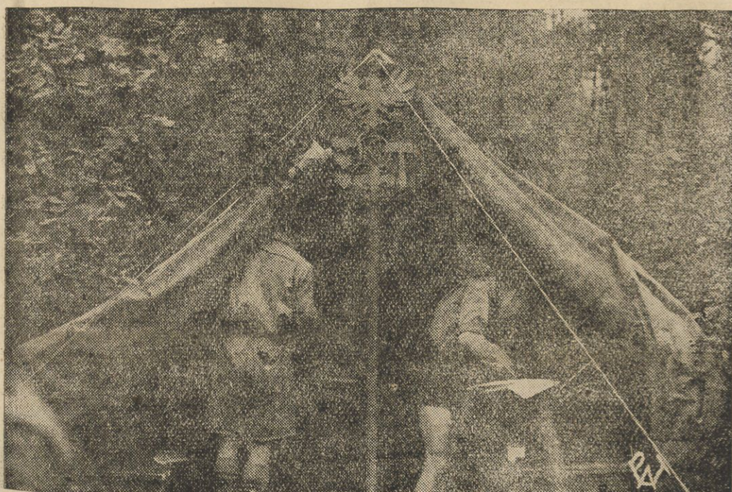
Drukarnia polowa w namiocie w obozie harcerskim w Spale, w której drukuje się dziennik obozowy „Więści Złotowe“, oraz komunikaty i rozkazy.