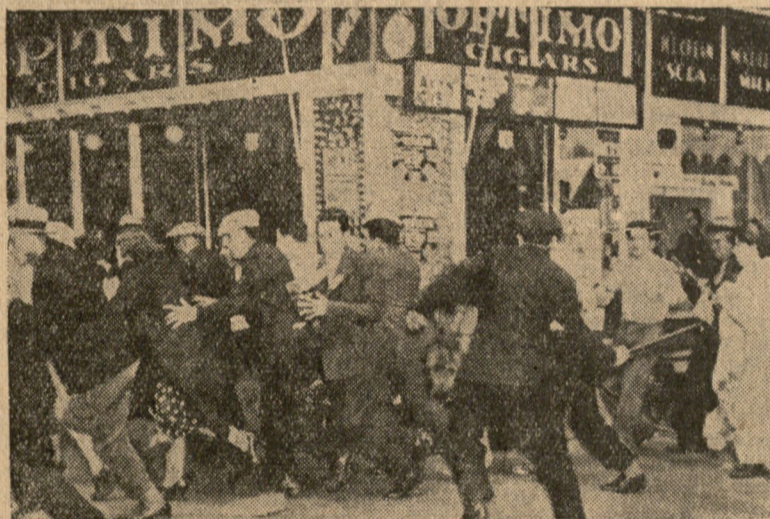
Zdjęcie przedstawia demonstrujących strajkujących windziarzy na ulicach New-Yorku, rozpraszanych przez policję.

Ten obowiązek jest tem lżejszy, tem przyjemniejszy dla Was, że pomiędzy narodem litewskim i łotewskim niema żadnych kwestyj spornych.“