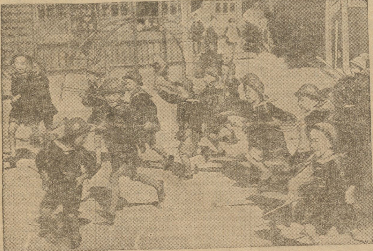
Podczas gdy ojcowie przedstawionych na zdjęciu chłopców znoszą frudy prawdziwej wojny w Chinach, ich kilkuletni synowie z zapalem słaczą bity na... rozrywkowych placach. Znamienny obrazek dla nastrojów w dzisiejszej Japonii.