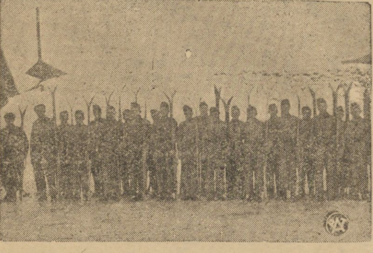
Grupa strzelców — amatorów narciarstwa, na kursie narciarskim, zorganizowanym przez Związek Strzelecki w Wilejce.