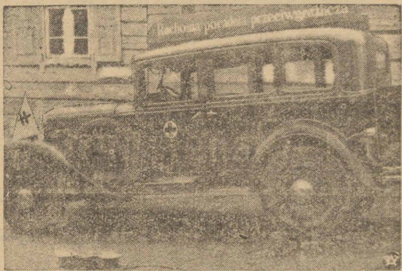
Pierwsza w kraju ruchoma poradnia przeciwgruźlicza ze składanym rentgenem i własnym napędem elektrycznym, własność Powiatowego Towarzystwa Przeciwgruźliczego Wileńsko-Trockiego. Należy zaznaczyć, że w ciągu ostatniego okresu w 20 szkołach wiejskich na terenie wymienionego powiatu, przeprowadzono badania za pomocą rentgena i prób tuberkulinowych chorych dzieci w wieku szkolnym.