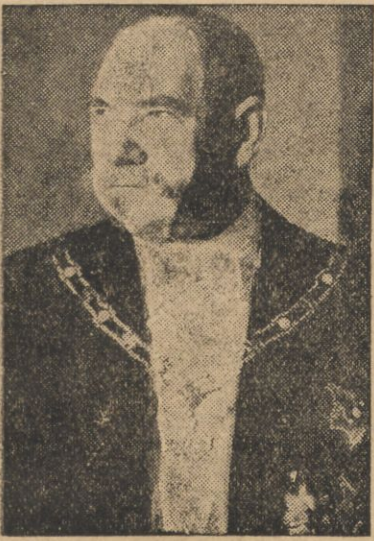
Prezydent Finlandji Svinhufvud.

Nie stało się to wskutek przychylnych okoliczności, lecz było wynikiem stopniowo dojrzewającej idei niepodległościowej. Po oderwaniu Finlandji od Szwecji,