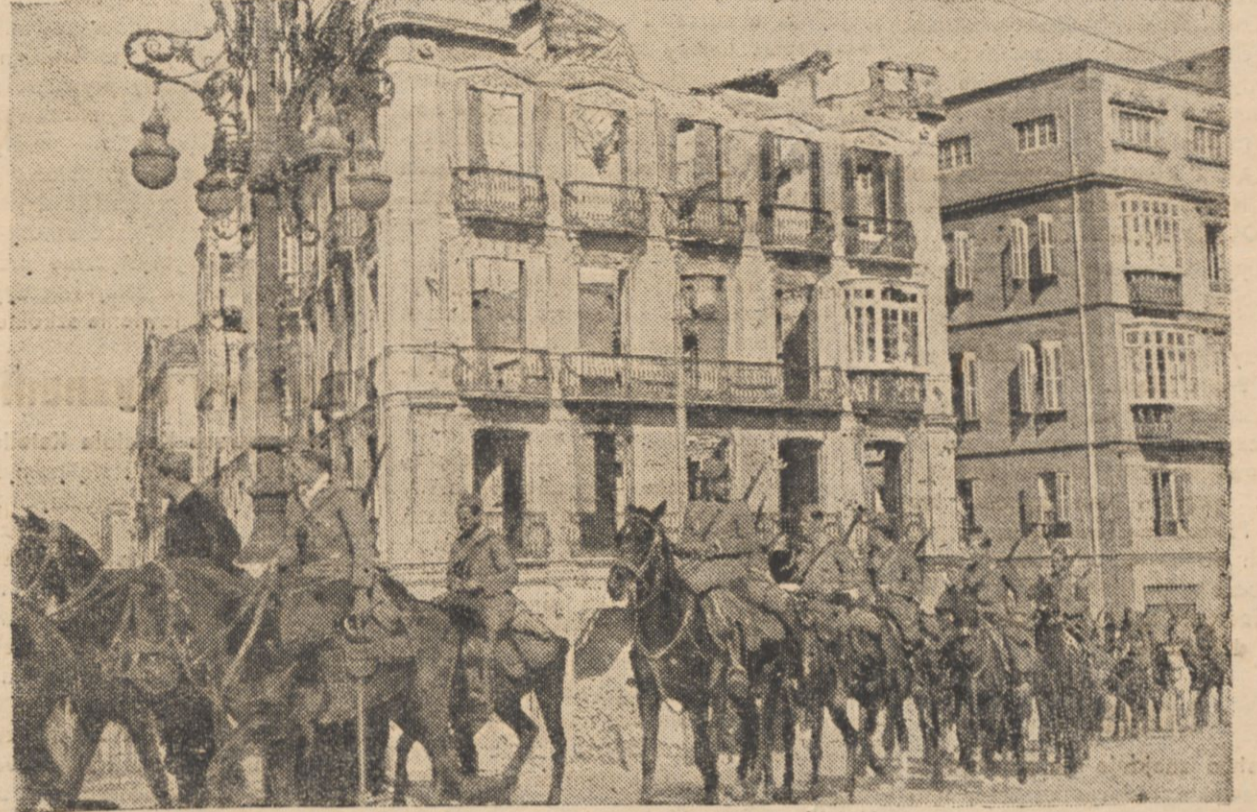
Jedno z pierwszych zdjęć Malagi po zdobyciu jej przez powstańców. Do Malagi wkrocza kawaleria gen. Franco.