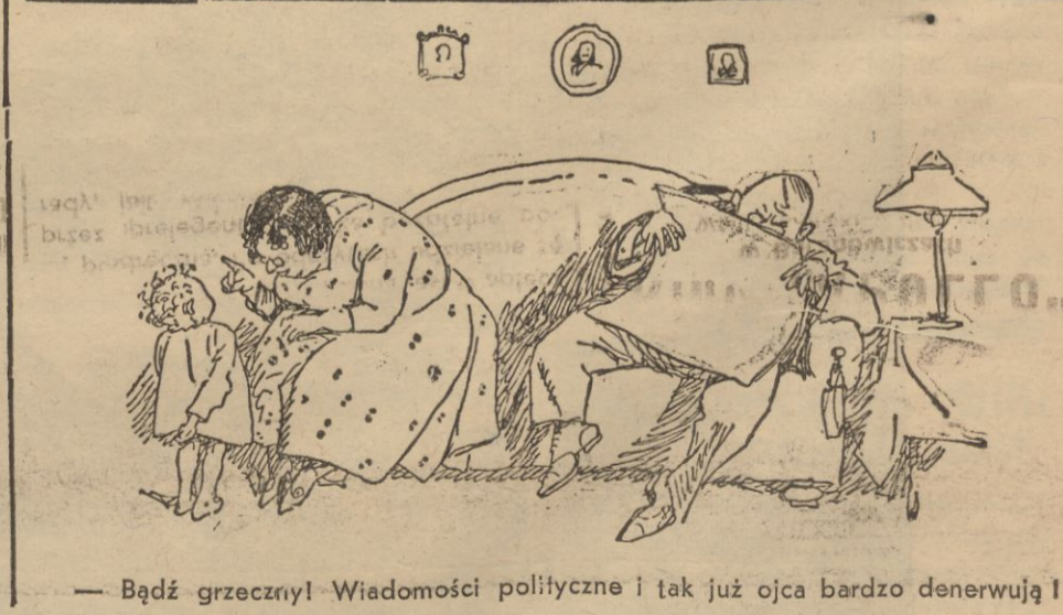
— Bądź grzecznym! Wiadomości polityczne i tak już ojca bardzo denerwują!

REDAKCJA I ADMINISTRACJA Konto P.K.O. 700.312, Konto rozrach. 1, Wilno 1 Centrala: Wilno, ul. Biskupa Bandurskiego 4 Redakcja: tel. 79. Godziny przyjęć 1—3 po południu Administracja: tel. 99—czynna od godz. 9.30—15.30 Drukarnia: tel. 3-40. Redakcja rękopisów nie zwraca.