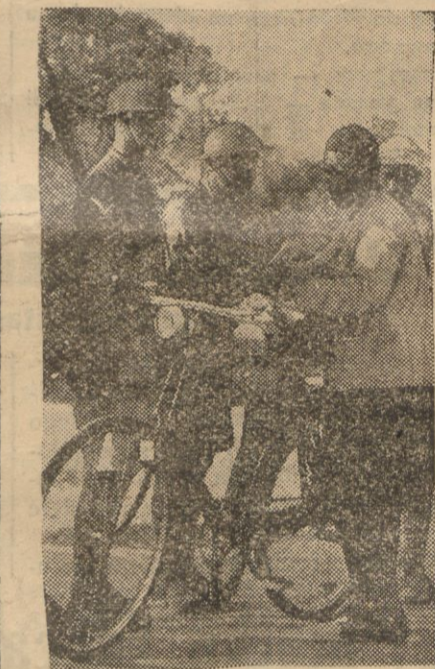
Żołnierze angielscy przeprowadzają rewizję rowerzysty na ulicy Jeruzolimy.