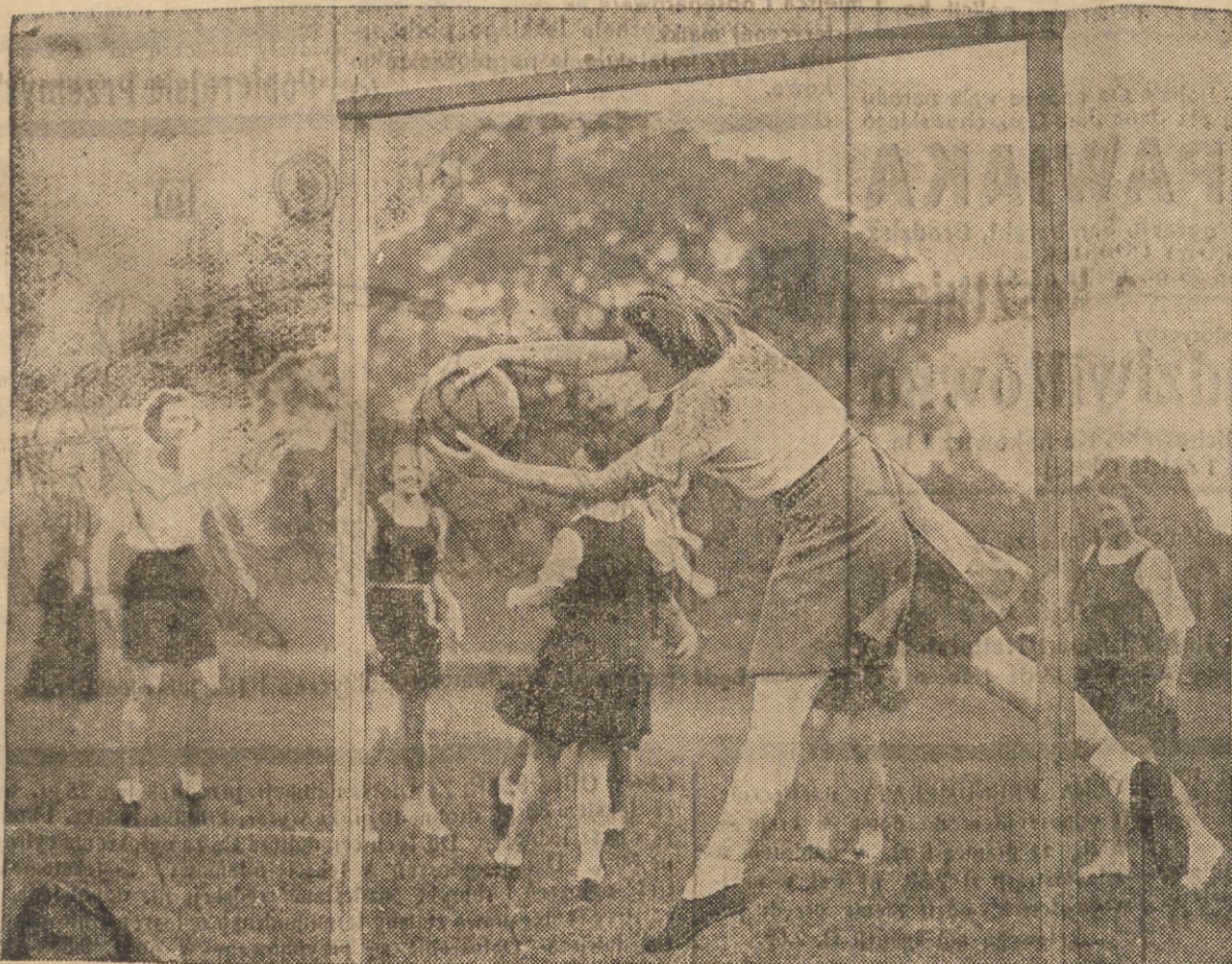
Instruktorka uczy, jak trzeba chwycić prawidłowo piłkę.