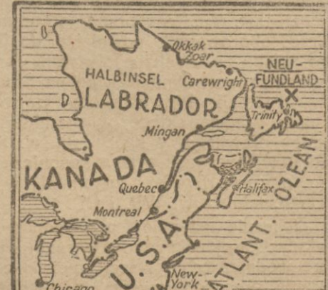
Mapa miejsca katastrofy. Przy wybrzeżu wyspy Nowa Fundlandia widoczny czarny krzyżyk...