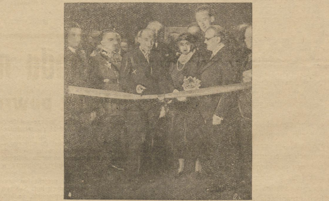
W dniu dzisiejszym odbyło się w Instytucie Propagandy Sztuki otwarcie nowej wystawy. O- twarcia wystawy dokonał p. prezes Rady Ministrów Janusz Jędrzejewicz. Na zdjęciu naszym widzimy p. premiera, przecinającego wstęgę.