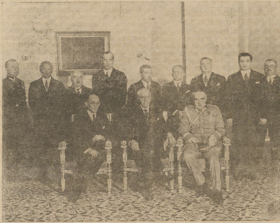
Na zdjęciu naszym widzimy Pana Prezydenta R. P. w otoczeniu członków nowego rządu, w chwili po zaprzysiężeniu. Siedzą od strony lewej: p. Prezes Rady Ministrów Jędrzejowicz, p. Pan Prezydent R. P. i p. Pan Marszałek Józef Piłsudski. Stoją od strony lewej: p. minister Poczt i Telegrafów p. plk. Kaliski, minister przemysłu i handlu dr. Zarzycki, minister opieki społ. dr. Hubicki, minister spraw zagranicznych Beck, minister skarbu Zawadzki, minister komunikacji inż. Butkiewicz, minister sprawiedliwości Michalowski, minister Spr. Wewn. Pieracki i inż. Rolnictwa i Reform Rolnych dr. B. Nakoniecznikoff-Klukowski.