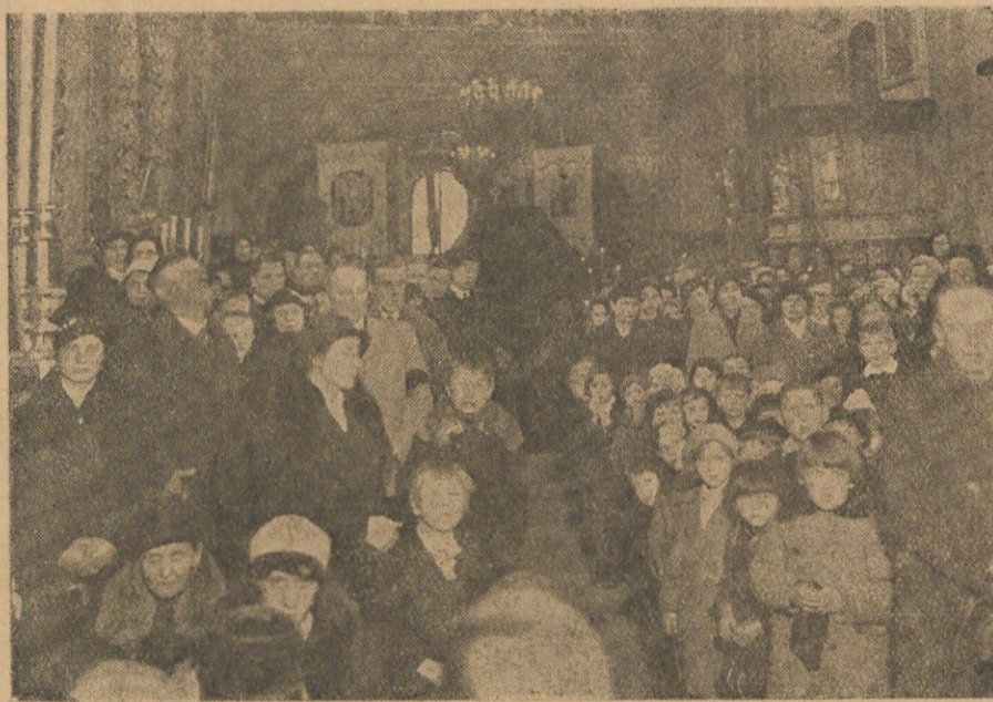
Na nabożeństwie żałobnym w kościele św. Trójcy w Kownie.

Już przed wieczorem ukazały się na ulicach okryte krepą czapki polskich studentów, znaczki polskich organizacji społecznych lub wprost wpięte w klapy kokardy z krepą. W lokalach organizacji polskich wywieszono ubrane krepą portrety Marszałka.