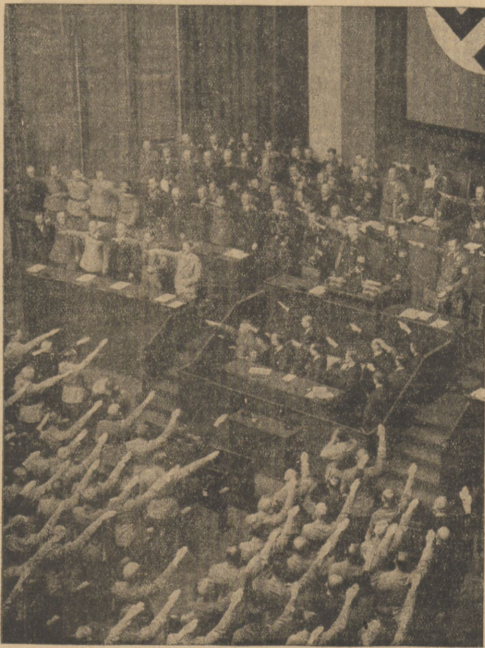
Reichstag w dniu 21 b. m.

„Niechże więc ta Wszchnica, którą dziś tu otwieram, zgodnie z tradycją tej ziemi nie ziele nigdy jadem nienawiści, nie kroczy nigdy drogami, które dla nas Polaków, tak ciężkimi były. Niech krzepi jasnowidztwem wiedzy, potęgą myśli twórczej, umiejętną i skrętną pracą naukowego rzemiosła”.