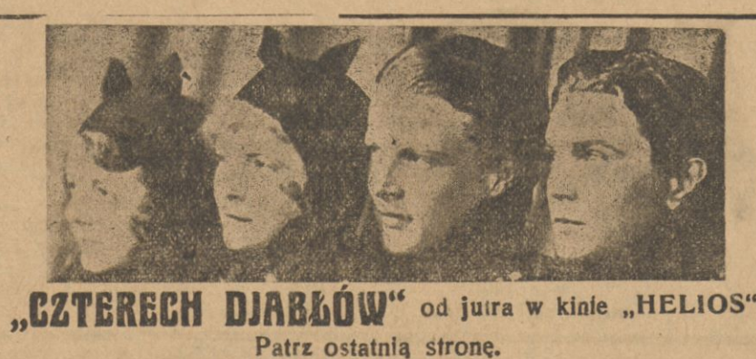
„CZTERECH DJABŁÓW” od jutra w kinie „HELIOS” Patrz ostatnią stronę.

Wszystko świadczyło o poszarpaniu nerwów przez obsoltną niepewność jutra, oraz tortury cielesne i moralne zadawane przez czerwonych katów.