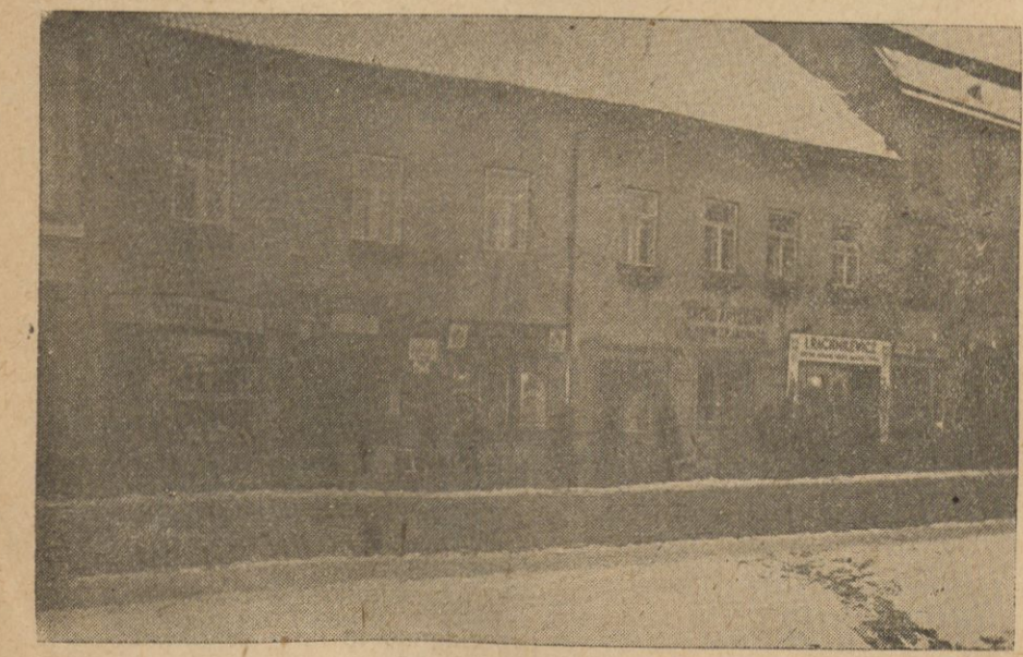
Dom Nr. 46 przy ul. Wielkiej.