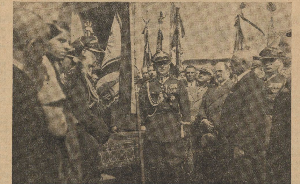
Na zdjęciu moment po poświęceniu sztandaru Związku Peowiaków Okr. Wileńskiego w dniu 29 b. m. Pośrodku gen. Rydz-Śmigły.

Jadwiga Goszczycka (Kijów). „Żywa, wesoła, ujmowała wszystkich swym wdziękiem i subtelnością...” „Została aresztowana w Kijowie, 8