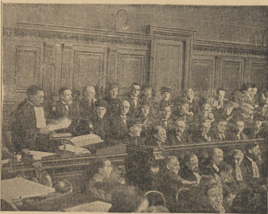
Ława oskarżonych podczas przewodu sądowego o aferę Stawiskiego.