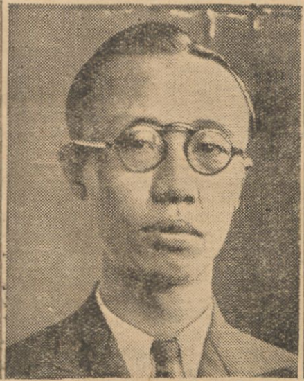
Pou-I, cesarz Mandżuko.

Od czterech lat Japonja jest w posiadaniu Mandżurji. Od wiosny b. r. panuje w Chinach Północnych. Chiński aparat państwowy w tej dzielnicy został