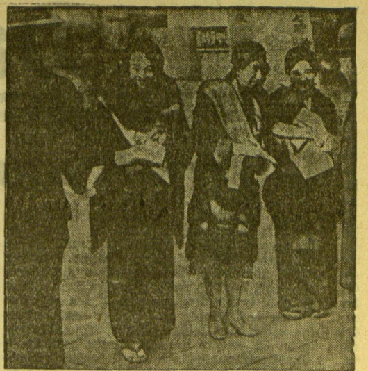
Bibesgabensammlung in den Straßen Tokios. Studentinnen der Musikakademie in Tokio sammeln in den Straßen der Hauptstadt Bibesgaben für die in der Mandschurei kämpfenden Truppen.

Die Tatsache, daß sich die deutsche Heeresleitung im Weltkrieg veranlaßt sah, auf dem Umwege über die Schweiz Aluminium für das Gerippe der Zeppelin sowie Karbide und Cyanamid für Sprengstoffe ausgerechnet aus Frankreich zu beziehen (Bauxit, aus dem Aluminium gewonnen wird, gab es damals nur in der Provence) und andererseits sich der französische Generalstab durch Vermittlung neutraler Länder die hochwertigen deutschen Magnetapparate aus Deutschland zu verschaffen wußte, begründete vor nicht langer Zeit der bekannte französische Nationalökonom Francis Delattre in der Zeitschrift „Le Crapeauillot“ damit, daß für Regierungen und Heeresleitungen ein Krieg ohne entscheidenden Sieg nutzlos sei, da er später dann fortgesetzt werden müsse. Es läge im beiderseitigen Interesse der Kämpfenden, sich gegenseitig die Mittel zu verschaffen, um den Krieg „bis zum