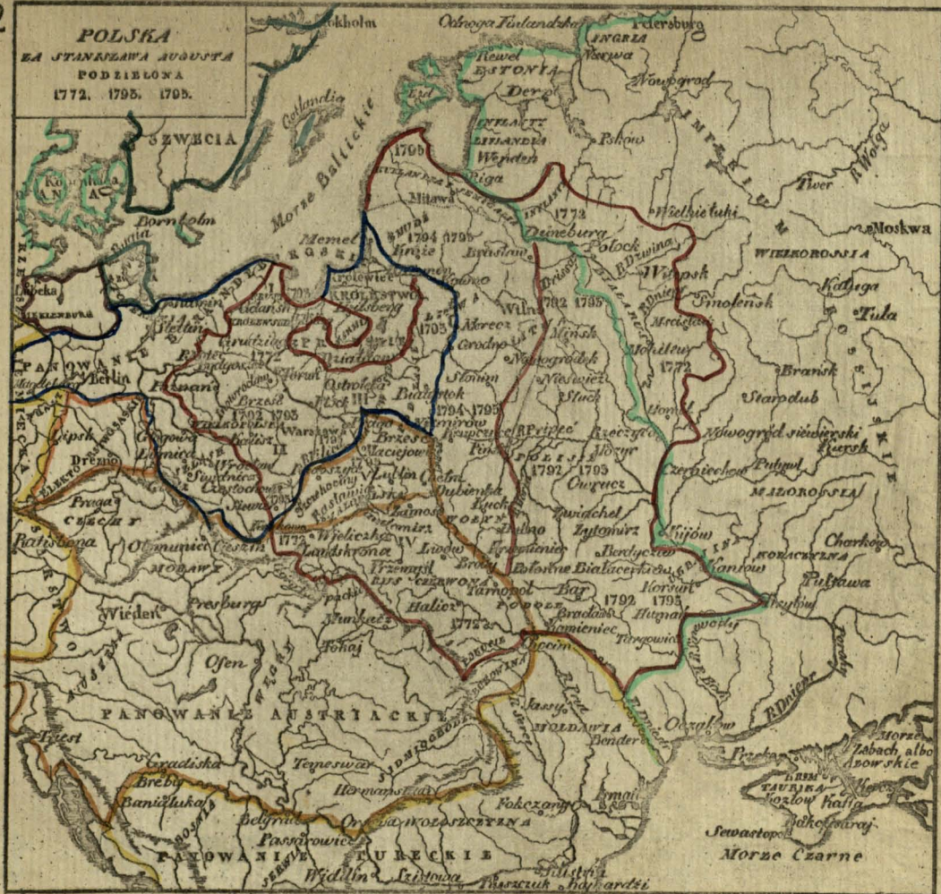
I. Prusy zachodnie. II. Prusy południowe. III. Prusy wschodnie. — IV. Galicja i Lodomeria. V. Galicja nowa