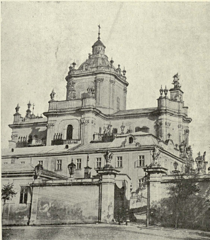
Šv. Juro bažnyčia unitų ukrainų arkikatedra, 1746 m. unitų vysk. Atanazo Šeptickio statyta, gražaus renesanso rokoko stiliaus. Pirmutinę medinę bažnyčią toje vietoje, sako, buvęs pastatęs kunigaik. Levas, Vaišilkos, Voluinės kun., prašomas.

Galima buvo laukti, kad dalykų stovis žymiai