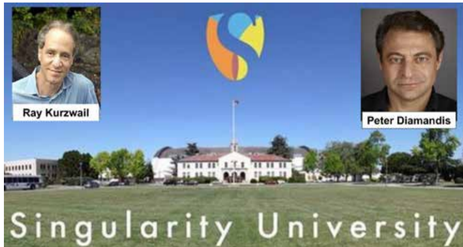
Singularumo universiteto įkūrėjai: ideologas – dr. R. Kurzveilas ir vykdytysis kūrėjas bei vadovas dr. P. Diamandis

plačiojoje žiniasklaidoje beveik nieko neskelbiama. Mūsų jaunimas žino apie Harvardo ir Kalifornijos (JAV), Kembridžo ir Oksfordo (JK) universitetus bei Masačusetso ir Kalifornijos technologijos institutus (angl. Caltech) JAV.