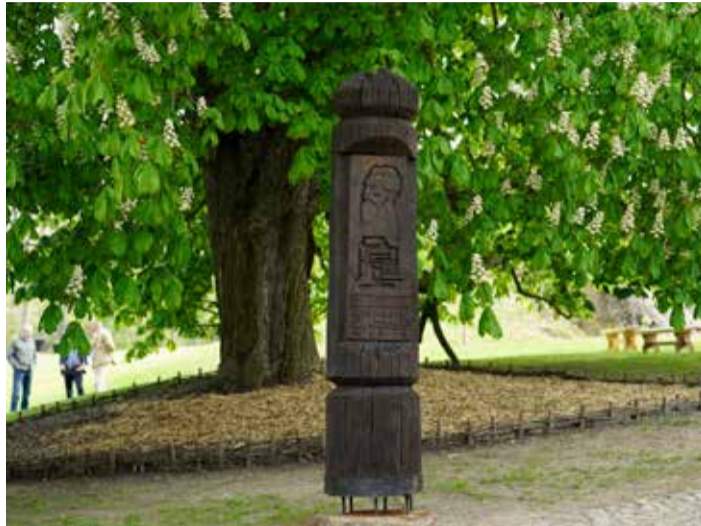
Jono Basanavičiaus sodybos kieme augantis kaštonas.