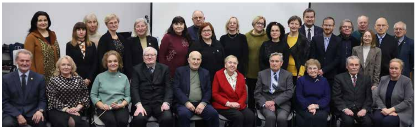
LKD Šiaulių skyriaus nariai, paminėję veiklos 35-metį

LKD Šiaulių skyrius pranoksta kitus 20 draugijos skyrių pirmiausia narių skaičiumi. Šiaulių skyriuje beveik visą laiką buvo bene daugiausia lietuvių kalbai neabejingų įvairių profesijų ir specialybių atstovų, ne tik lituanistų dėstytojų ir mokytojų. Dauguma šių žmonių savo mokslinė, pedagoginė veikla gerai žinomi visoje Lietuvoje (tarp jų yra 20 mokslo daktarų). Kiti, nors nerašė mokslo darbų, neleido vadovėlių, bet nuoširdžiai ir