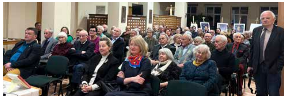
Knygos sutiktuvėjų renginio dalyviai