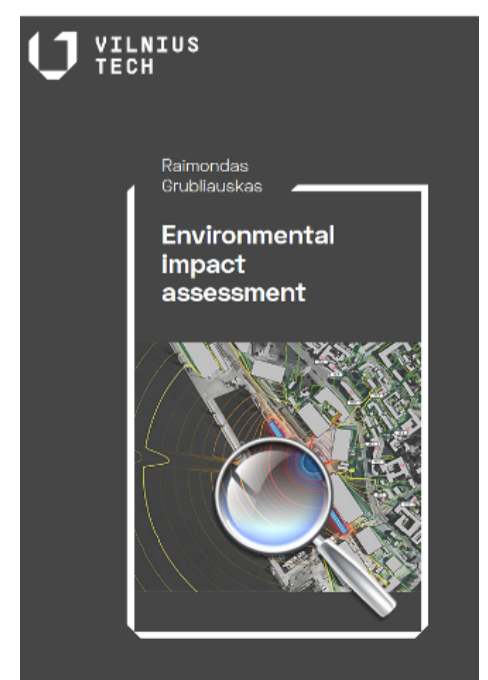
Projekto GEOCLIC metu parengti leidiniai