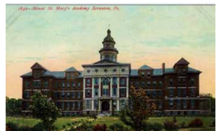
Šv. Marijos akademija Skrantone