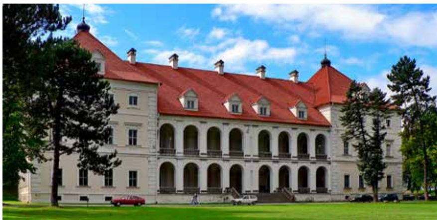
Biržai – 2024-ųjų Lietuvių kalbos dienų sostinė. Biržų pils.

Užsienio lietuvių bendruomenėse šiuo laikotarpiu vyks Lietuvių kalbos dienų viktorina, kurioje dalyvaus beveik 90 bendruomenių iš daugiau kaip 20 pasaulio šalių. Vasario 27 d. Lietuvos mokslų akademijoje bus įteikti dešimtieji „Sraigės“ apdovanojimai, kuriuos VLKK skiria už reikšmingus lietuviškos terminijos kūrimo darbus, mokslo kalbos