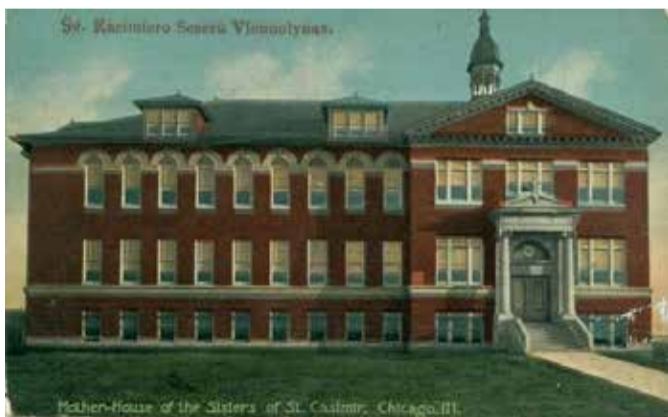
Šv. Kazimiero vienuolynas Čikagoje