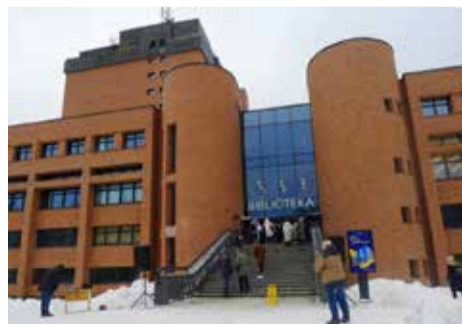
Ažuolyno biblioteka Kaune

Sausio 19 d. Kaune, Mažajame ažuolyne, po dvejus su puse metų trukusios rekonstrukcijos atidaryta atnaujinta Kauno apskrities viešoji biblioteka, pervadinta į Ažuolyno biblioteką (Radastų g. 2). Ši biblioteka yra didžiausiam ažuolyne Europoje, esančiame miesto teritorijoje, paskelbtame respublikinės reikšmės kultūros paminklu ir įtrauktame į Lietuvos kultūros vertybių registrą. Bibliotekoje, atidarytoje 1987 m., dominavo posovietinio modernizmo interjeras. 2021 m. spalio viduryje pastatas buvo uždarytas lankytojams ir prasidėjo jo atnaujinimas. Dabartinis interjeras, ko gero, yra moderniausias šalyje. Čia – ir krėslai, įrengti pačiose lentynose, ir augalų sodas, ir kompiuterių „baras“ ar net masažiniai krėslai su atsiveriančiu vaizdu į parką bei kiti įdomūs dalykai. Ateityje čia bus įrengtos apie 400 kv. m terasos su nedidele