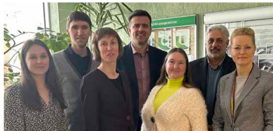
ERASMUS + projekto GEOCLIC dalyviai